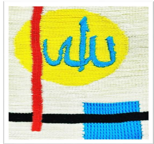
المعلقة النسجية الخامسة عشر