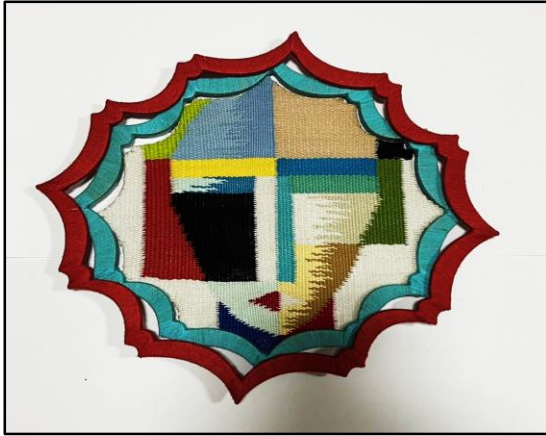
المعلقة النسجية العشرون