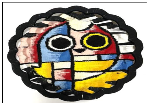
المعلقة النسجية الخامسة