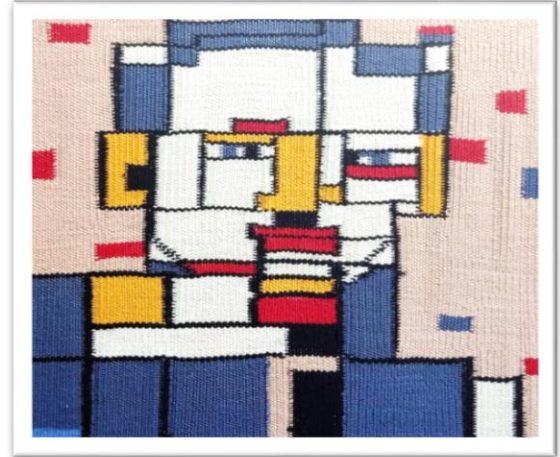
المعلقة النسجية التاسعة عشر

خطوات بناء استمارة الإستبيان لتقييم المعلقات النسجية ناتج التجربة البحثية : خطوات بناء الإستبيان :