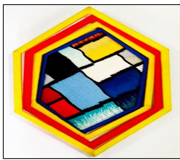
المعلقة النسجية الحادية عشر