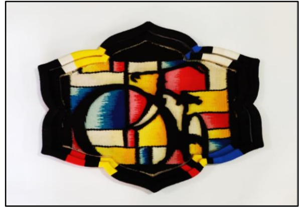
المعلقة النسجية الأولى