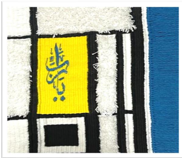
المعلقة النسجية السادسة عشر