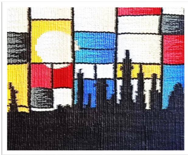
المعلقة النسجية الثانية عشر

المحور الثاني: الدمج بين أسلوب موندريان من حيث (تقسيمات الخطوط)، وأسلوب الفن الإسلامي من حيث ( التجريد في الكتابات والزخارف).