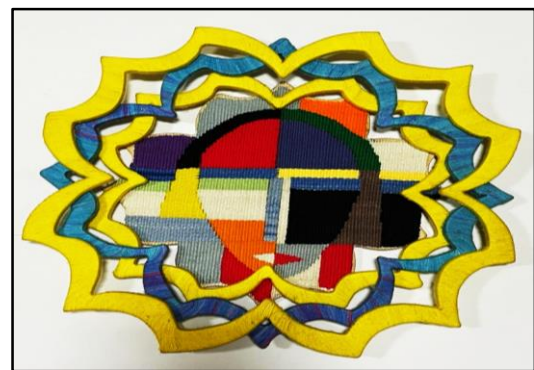
المعلقة النسجية السابعة عشر