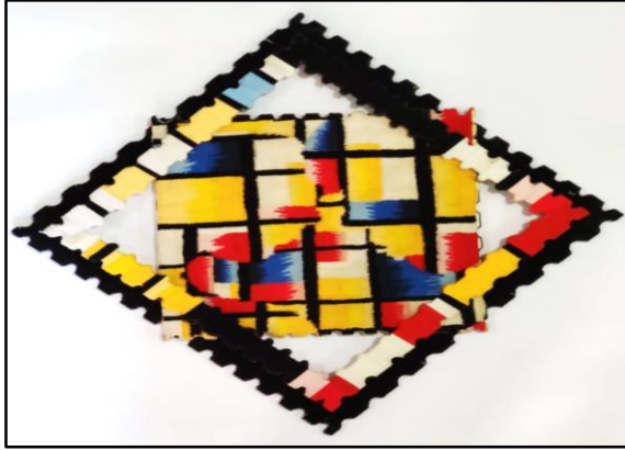
المعلقة النسجية الثانية

المحور الأول: تناول أسلوب موندريان مع إضافة عناصر (عضوية أو غير عضوية)، (بارزة أو مسطحة) للمعلقات النسجية