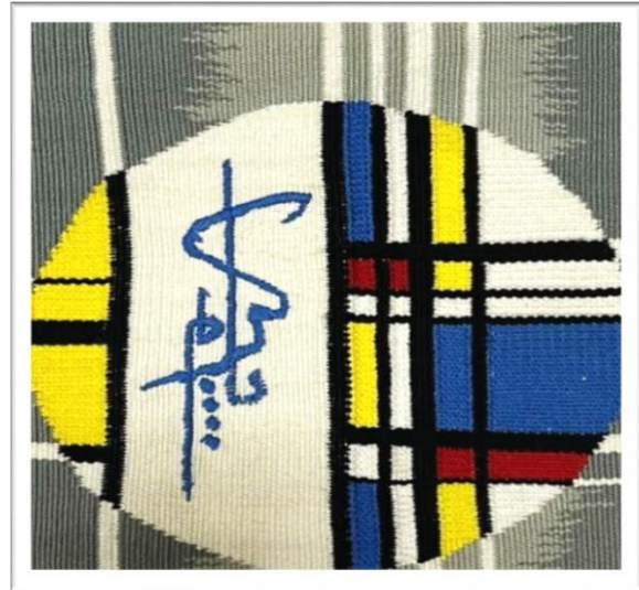
المعلقة النسجية الثالثة عشر