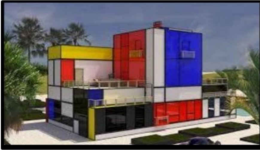
صورة رقم (٢) نموذج من تصميمات العمار والقرى السياحية بتصميمات هندسية مستوحاه من أعمال موندريان