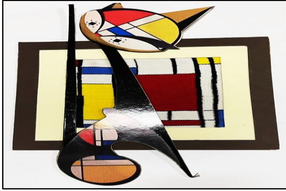
المعلقة النسجية الثامنة