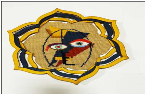
المعلقة النسجية الثامنة عشر

المحور الثالث: تناول أسلوب موندريان في معالجته للموضوع مع تغيير المجموعات اللونية.