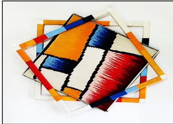
المعلقة النسجية العاشرة