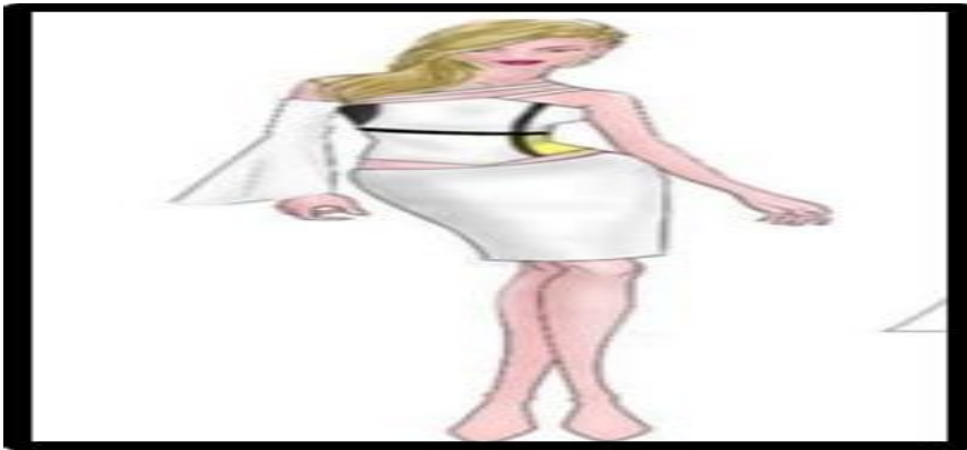
صورة رقم (٣) تصميمات أزياء مستوحاه من أعمال موندريان.