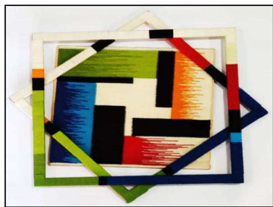
المعلقة النسجية التاسعة