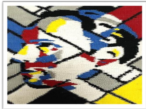
المعلقة النسجية الثالثة