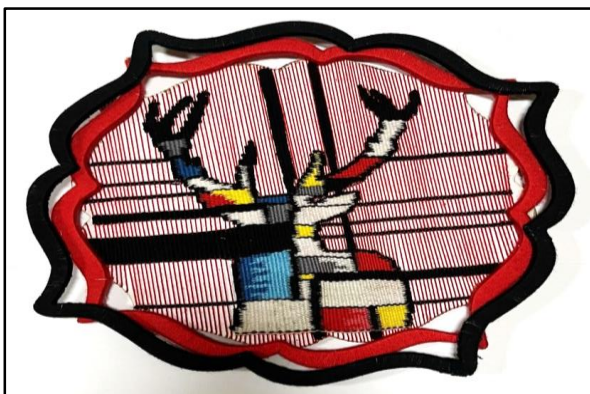
المعلقة النسجية السادسة