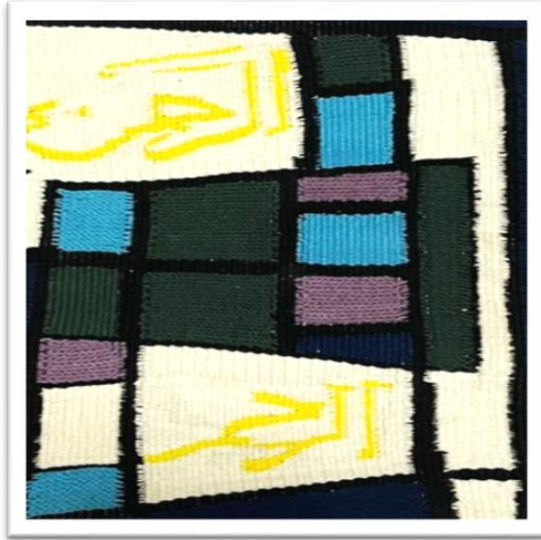
المعلقة النسجية الرابعة عشر