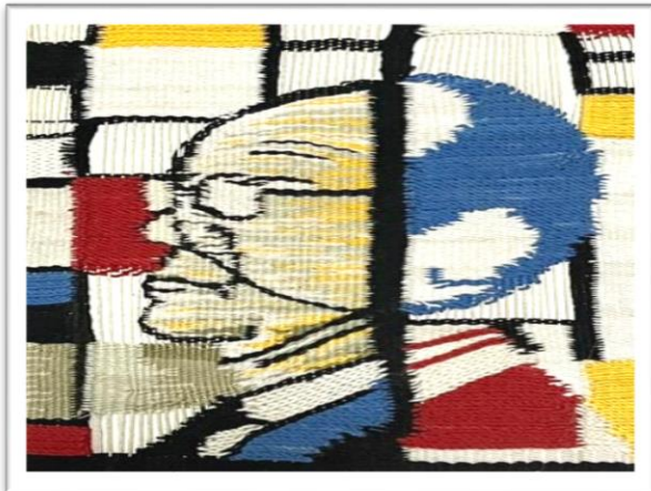
المعلقة النسجية الرابعة