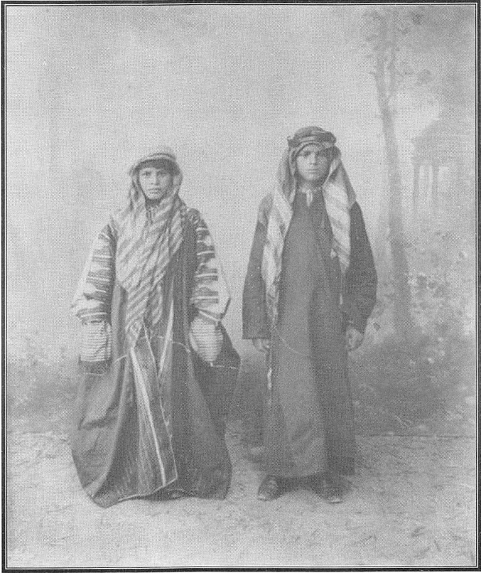
صور ملتقطة لأبناء شيوخ العشائر بزيهم المحلي في استوديو التصوير باسطنبول

http://photo.am/main.php?iview=dynamicalbum.UpdatesAlbum (1) ishow=data ialbumId=12030itimeframe= icategory= iphotographers =false iitemId=12072