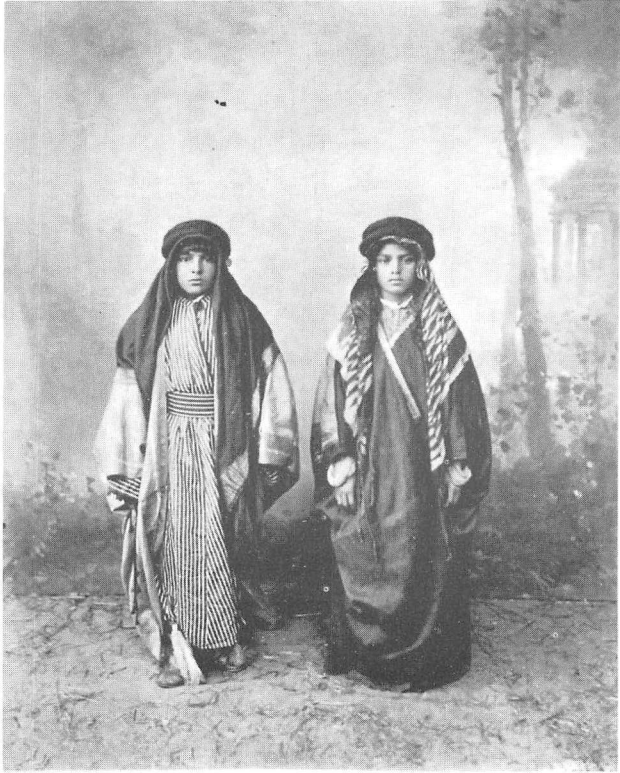
صورة رقم (5)