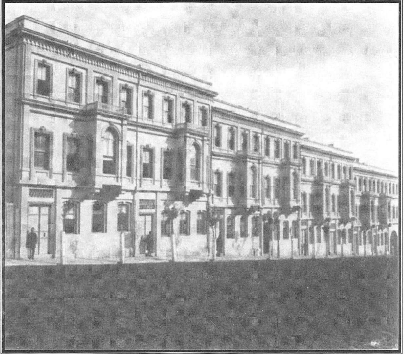
بنایة مدرسة العشائر (1)

http://upload.wikimedia.org/wikipedia/tr/5/57/A%C5%9Firet_Mekte- (1) bi.jpg