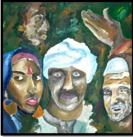
شكل رقم (٢١) من أعمال الطلاب (أعضاء جسم الانسان) بألوان الزيت