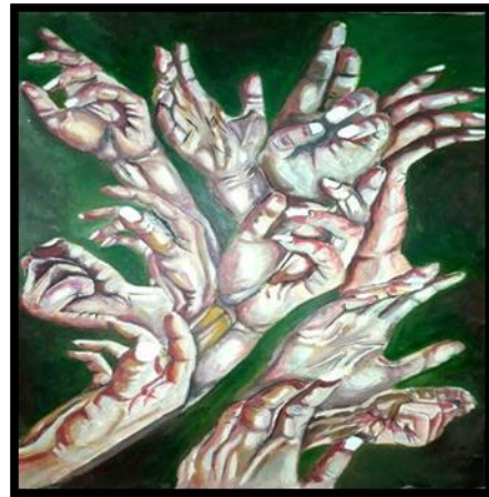
شكل رقم (١٦) من أعمال الطلاب (أعضاء جسم الانسان) بألوان الزيت