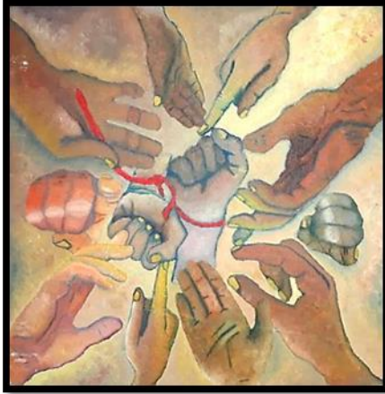
شكل رقم (١١) من أعمال الطلاب (أعضاء جسم الانسان) بألوان الزيت