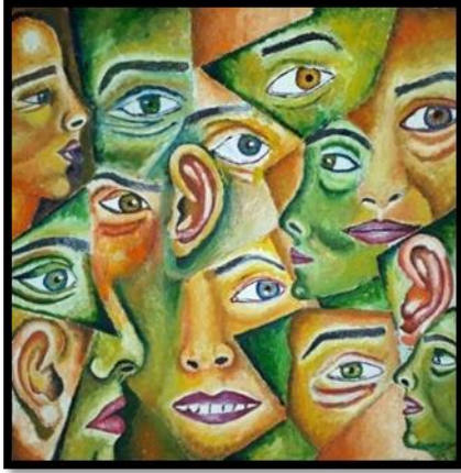
شكل رقم (٢٣) من أعمال الطلاب (أعضاء جسم الانسان) بألوان الزيت