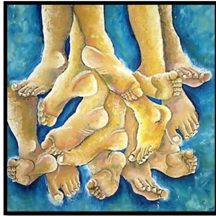
شكل رقم (١٤) من أعمال الطلاب (أعضاء جسم الانسان) بألوان الزيت