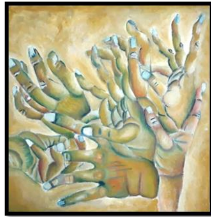
شكل رقم (١٢) من أعمال الطلاب (أعضاء جسم الانسان) بألوان الزيتية