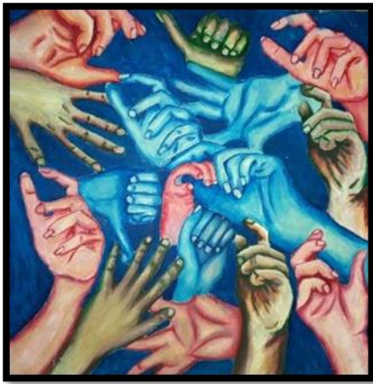
شكل رقم (١٣) من أعمال الطلاب (أعضاء جسم الانسان) بألوان الزيتية