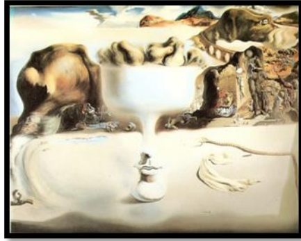
شكل رقم ( ٧ ) شهب وجه وطبق فاكهة علي الشاطي ( سلفادور دالي ) زيت علي نوال (١٩٣٨)

نتيجة الدراسة التحليلية لأساليب التعبير بمدارس الفن الحديث والتي تحقق الحركة ؛ حيث تعتمد الحركة في أعمال الفن الحديث علي أساليب التعبير للخط، واللون ، والبناء الفني وهذه العناصر اشتركت فيها جميع مدارس الفن الحديث. ومن خلال عرض ما سبق لأساليب التعبير في التصوير، ووسائل احداث الحركة من خلالها ، والذي يفتح المجال للقائمين علي تدريس التصوير لإخضاع الخامات التصويرية واجراء ممارسات تجريبية للطلاب تساعدهم في إنتاج أعمال تصويرية للتعبير عن انفعالاتهم وجذب عين المتلقي لقيمة الحركة علي سطح الصورة من خلال الأساليب التعبيرية لعناصر التشكيل في العمل ، ومن هنا جاءت تجربة البحث الحالية.