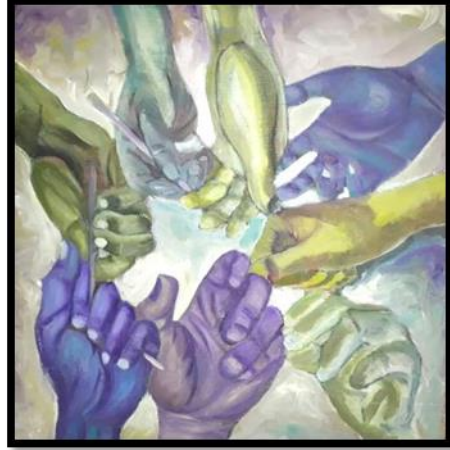
شكل رقم (١٠) من أعمال الطلاب (أعضاء جسم الانسان) بألوان الزيت