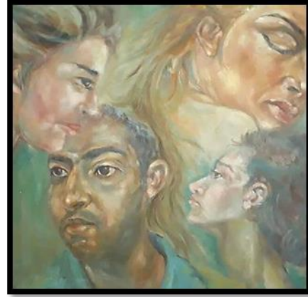
شكل رقم (٢٢) من أعمال الطلاب (أعضاء جسم الانسان) بألوان الزيت