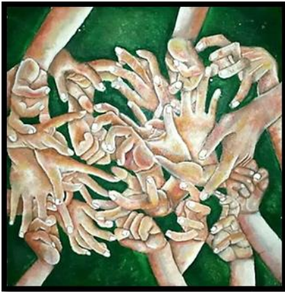
شكل رقم (١٥) من أعمال الطلاب (أعضاء جسم الانسان) بألوان الزيت