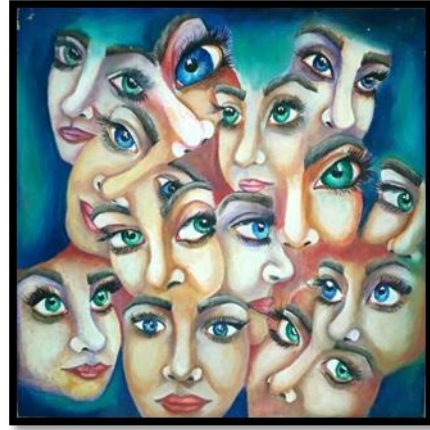
شكل رقم (٢٠) من أعمال الطلاب (أعضاء جسم الانسان) بألوان الزيت