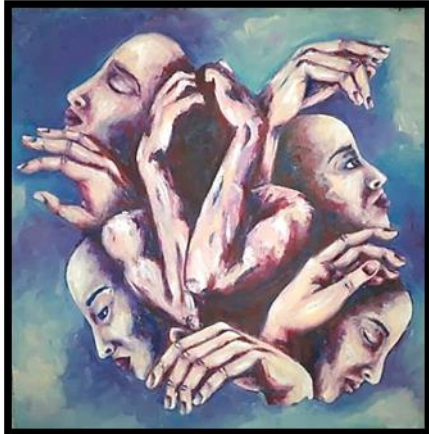
شكل رقم (٢٥) من أعمال الطلاب (أعضاء جسم الانسان) بألوان الزيت