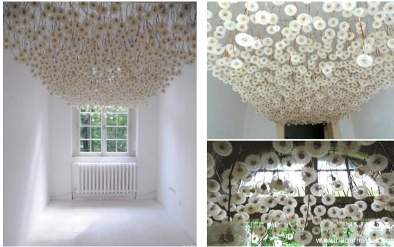
شكل رقم (٩) عمل للمصممة ريجين رامزين - نبات الهندباء

تعتبر الطبيعة هي المصدر الأساسي للعمل الخلاق، وليس مجرد صنع وإنتاج أي عمل أو تصميم وإنما هو يأتي إلى الوجود بقيم ومعان، ويحتاج التوصل إليها كل ما لدى المصمم من علم وخبرة وقوى فكرية ويتطلب أيضاً أن يكون لديه حس وقدرة خلاقية ومقدرة على التصور والتخيل. وبهذه القدرات الروحية يستطيع أن يستلهم المصمم من الطبيعة ويستخلص قوانينها ونظامها فيدرك منطق الطبيعة وينمي الإحساس بالحقيقة والواقع والتي تجعل الأشياء تتواجد وتأخذ شكلها المناسب كما هو بالشكل رقم (٩) حيث استخدمت المصممة ريجين رامزين Regina Ramsey نبات الهندباء في بعض أعمال الديكور الأكثر إبداعاً في ألمانيا حيث قامت برش النبات ببعض المادة اللاصقة حتى تحافظ على التصاقها ببعضها ووضعها مع بعضها في هذا الشكل الرائع.