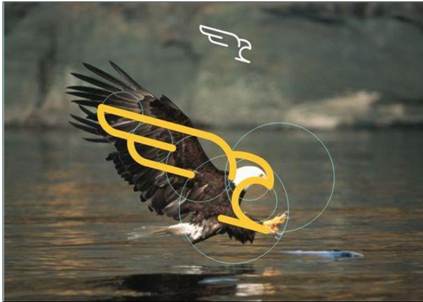
شكل رقم (١) يوضح كيفية استلهام الفنان والمصمم من الطبيعة

تعتبر الطبيعة هي الملهم الأول للمصمم الجرافيكي، والمصدر الرئيسي الذي يستمد منه الأفكار لخلق تصاميم فريدة. فكما قال هيربرت ريد: فالإبداع ليس حكراً على أحد ولا يتطلب الكثير من الخبرة أو الموهبة بل هو نتيجة الاستلهام الجيد والذي يمكن أن يبداه المصمم بالنظر إلى ما حوله والتدرب على الملاحظة ثم ممارسة ذلك بشكل تلقائي فيما بعد. وكلما يتمعن المصمم في الطبيعة زادت قدرته على استلهام الأفكار وكان له كبير الأثر على معارفه وإدراكه. ونلاحظ ان الطبيعة هي مصدر الالهام الأساسي لما تحتويه من عناصر مختلفة مثل الخطوط والمساحات والأشكال والملامس والألوان وغيرها وتخضع هذه العناصر لقوانين الطبيعة. ولأن المصمم يقضى معظم وقته في الاستلهام، نجد أن معظم المصممين يتمتعون بحساسية شديدة عن غيرهم من حيث إدراك الأشكال وما تحمله من المعاني الإبداعية كما هو موضح بالشكل (١).