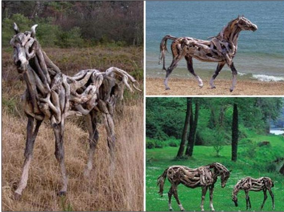
شكل رقم (٢) عمل للفنان هيثر جانيش

ففى بعض الأعمال الفنية الغربية والجميلة في نفس الوقت التي نفذت من الطبيعة، وحيث قام الفنان هيثر جانيش Heather Ganesh باستخدام الأخشاب في صناعة نسيج تقريبي عن طريق تجميع الأخشاب مع بعضها لأحد نماذج الطبيعة من الحيوانات وهو الحصان بحيث يكون بالحجم الطبيعي كما أنه قد صنع أكثر من واحد والمبدع أنه قد أوضح الكثير من تفاصيل الحركة لهذا الحيوان بعدة أخشاب كما بالشكل رقم (٢).