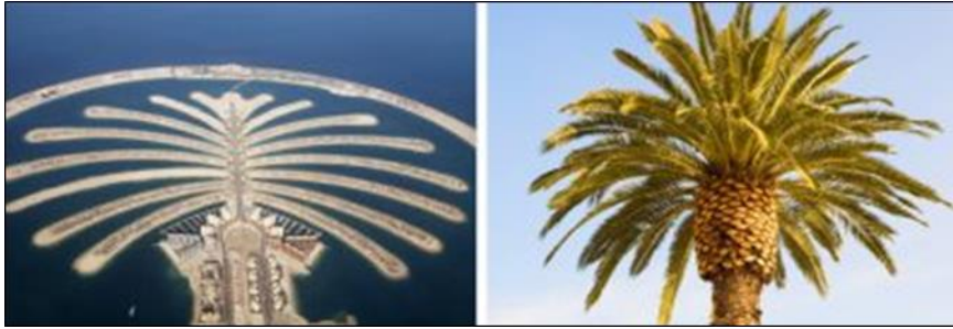
شكل رقم (٤) جزيرة النخلة - دبي - ٢٠٠٢

https://abunawaf.com/200916-صور-١٠-مباني-شهييرة-استوحت-تصاميمها-المعمارية-من-الطبيعة-٢٠٢١