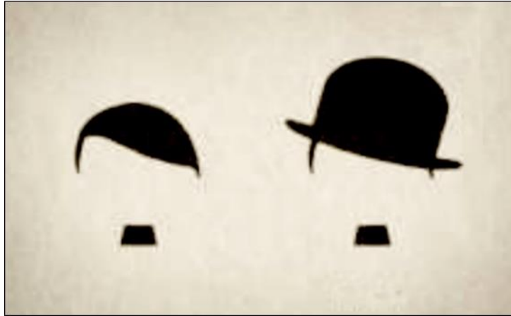
الشكل رقم (١٦) إعلان للشركة الألمانية Hut Weber Hats for Gentlemen لإنتاج قبعات يوضح الطابع الجمالي في صياغة الفكرة

https://comm425doranobrien.wordpress.com/2017/01/14/first-blog-post/