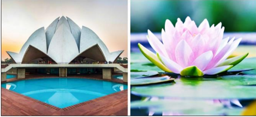
شكل رقم (٣) يوضح معبد اللوتس - نيودلهي - ١٩٨٦

في دبي ومستوحى من شكل النخلة، ونجد الفنان المصمم المبدع هو ما يستطيع ان يرى العلاقات بين العناصر بعضها البعض ويعمل على اعادة صياغتها بشكل مختلفة بما يحقق له رؤيته الفنية في تصميمه الجرافيكي.