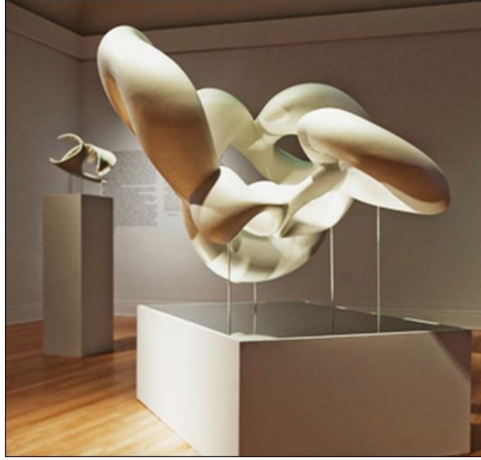
شكل رقم (١٤) مشروع تخيلي للمدينة الافتراضية للمعماري جريج لين - ٢٠١٠

https://www.evolo.us/greg-lynns-exploration-of-architecture-in-space/2021