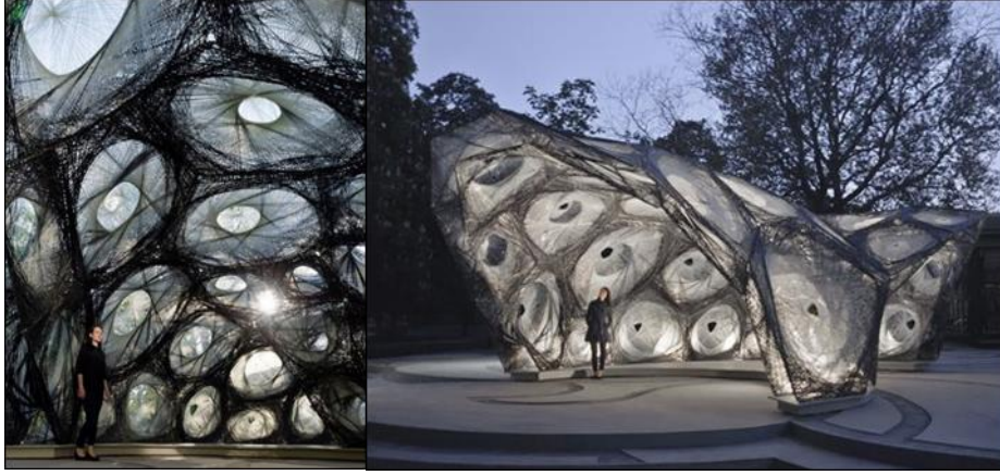
شكل رقم (٥) يوضح معرض جناح أبحاث في جامعة شتوتغارت

https://www.pinterest.com/pin/429249408236217566/2021