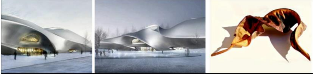
شكل رقم (١٢) عمل للمصمم بول ريكور- يوضح الاستعارة في الفن ورؤية الفنان وتحويل العالم الواقعي لشكل فني خيالي ياسر سيد البدوي عبد اللطيف محمد: "ميتافيزيقا الكون" استراتيجية استلهام متجددة لإبداع فني بفكر مستدام - بحث منشور- جامعة حلوان - كلية الفنون التطبيقية- قسم التصميم الداخلي والأثاث- ٢٠١٩

لذلك يمكننا القول إن الاستعارة البصرية صارت محرك بصري من خلال التقنية المعتمدة على الخط والشكل واللون وبالتالي منحتها استقلاليتها فتمتلك حركتها وإيقاعها ومعناها الجديد. إن هذا الجوهر العام يستند إلى مفهوم الجمالية والتي من خلالها استحلال الفن ليس هو بالجميل، وإنما يسمى هكذا لأنه ينتج الجميل، والجمال هنا يقوم على الاستعارة من الواقع الذي يتطابق مع الخيال. فيتحقق موضوعاً جديداً في ذاته ولذاته، فالعناصر التشكيلية المعتمدة على الشكل الطبيعي الظاهر صارت في تركيبة بصرية جديدة.