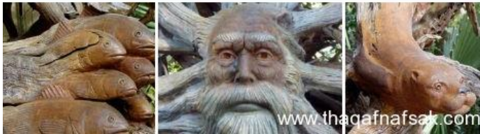
شكل رقم (١١) عمل للمصمم بول باليكر - تكوينات نباتية

https://www.thaqafnafsak.com/2014/04/10-أعمال-فنية-مبدعة-2022.html-من-الطبيعة