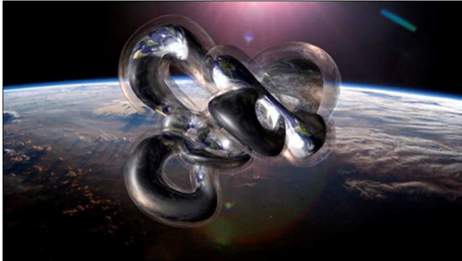
شكل رقم (١٥) مشروع تخيلي للمدينة الافتراضية للمعماري جريج لين - ٢٠١٠

https://www.evolo.us/greg-lynns-exploration-of-architecture-in-space/2021