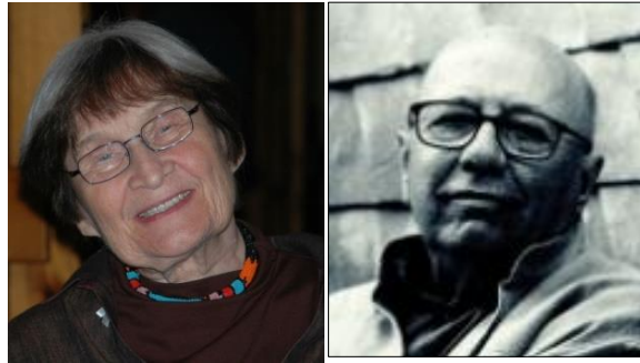
الفنان ستانيسلاف ليبينسكي - الفنانة جاروسلافا بريشتوفا