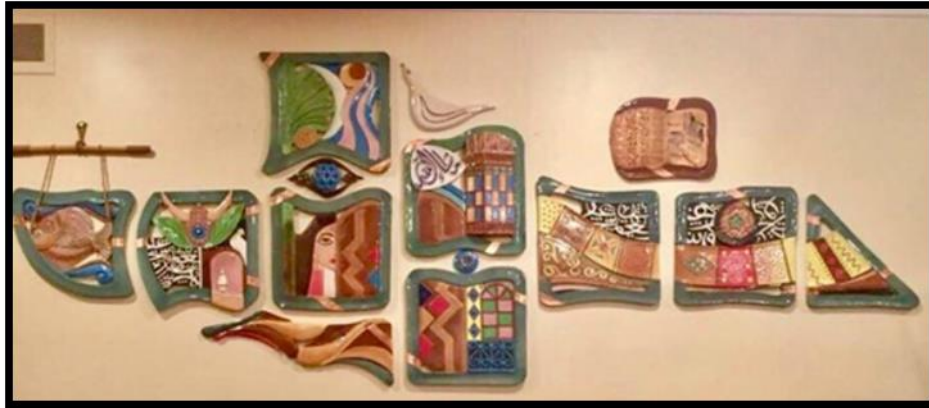
التراث سفينة العراق، بسام ريجارد،

- التراث سفينة العراق للفنان بسام ريجارد Heritage Ship Iraq by artist Bassam Rigaard