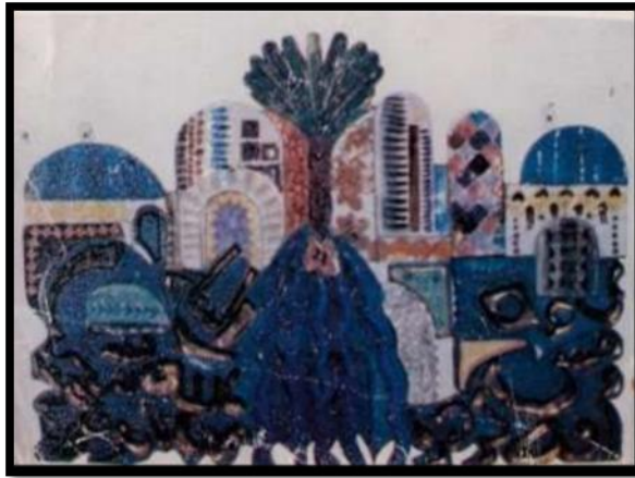
سهام السعودي، تكوين جداري، ١٩٨٠

- تكوين جداري للفنانة سهام السعودي A mural Composition by the artist Siham Al-Saudi