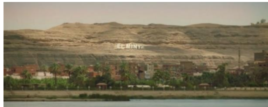
لقطة رقم (١)

يبدأ المشهد بلقطة extreme long shot للموقع المكاني الذي يتم فيه تم فيه تصوير المشهد وهو (المنيا) في لقطة جميلة للنيل والطبيعة الخلابة التي تتميز بها المنيا كما هو موضح في اللقطة (١)