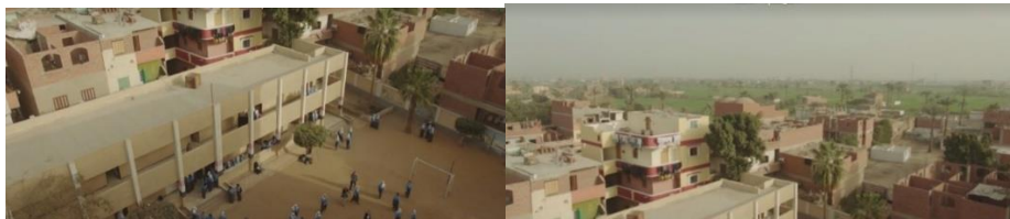
لقطة رقم (٢)

وتأتي بعدها لقطة long shot للمدرسة التي يقوم البطل (احمد السقا) فيها بالتدريس في احد قري المنيا وهي قرية (ملوي) في حركة tilte down من السماء والمنازل حول المدرسة وصولاً إلي المدرسة كما هو موضح في اللقطة (٢) .