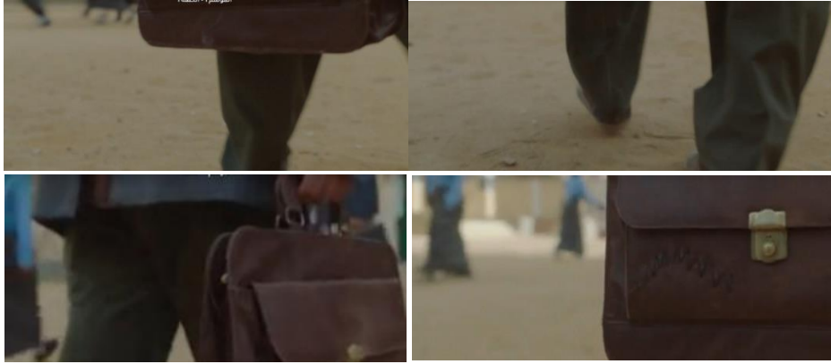
لقطة رقم (٣)

وبعدها تأتي لقطة مقربة لقدم وهي تسير في لقطة close up shot وتتحرك الكاميرا من خلف القدم نحو الامام في حركة tilte up لتظهر يد تمسك شنطة قديمة بها بعض الشقوق وتظهر في الخلفية بنات ترتدي الزي المدرسة في لقطة out of focus وتظهر الشنطة في مقدمة اللقطة في وضوح تام كما هو موضح في اللقطة (٣).