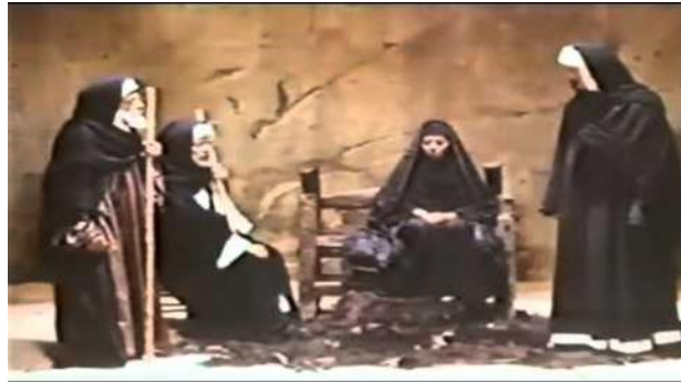
شكل (٢) يبين أثر حجم اللقطة في التكوين والاتزان من فيلم المومياء لشادي عبد السلام تصوير عبد العزيز فهمي

برغم الاعتقاد السائد بأن الكاميرا تسجل صورة مطابقة للواقع إلا أن هذا التطابق هو في حقيقته تطابق ظاهري ولا يمثل صورة طبق الأصل تماما. فمن الناحية المبدئية، هناك فوارق رئيسية بين رؤية الكاميرا للواقع، ورؤية الإنسان له. وهذه الفوارق كما يقول "رودلف ارنهيلم" في كتابه "فن السينما" تمثل في مجملها قصورا في رؤية الكاميرا بالمقارنة بالرؤية الإنسانية، ولكنه بمثابة القصور الإيجابي الذي جعل من الفيلم فنا. ومعرفة السينمائي للعناصر التي تكون هذا القصور تمثل أساسا هاما في توظيفه الخلاق للصورة السينمائية، ومن خلال حجم اللقطة يمكن توظيف القيم البلاغية بكل من العمق الميداني والاتزان والتجانس اللوني.... وغيرها مما سبق ذكره في الصورة الثابتة، كما أن كل حجم من أحجام اللقطة له بلاغته عند توظيفه في سياق السرد. والشكل (٢) يوضح أثر حجم اللقطة في التكوين والاتزان، واللقطة من الفيلم المصري (المومياء...يوم أن تحصى السنين) إخراج شادي عبد السلام، وتصوير عبد العزيز فهمي.