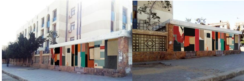
مقترح تجميل سور المعهد العالى للفنون التطبيقية - التجمع الخامس شكل (٣٤) شكل (٣٥)

اعتمد فى بناءه على تشكيل هندسى مجرد تتضح فيه قيمة الإيقاع من خلال توزيع الأشكال على سطح العمل بتنوع فى الشكل والمساحة فلا ترى الا مساحات وألوانا بلا دلالات بصرية وحذفت كل التفاصيل، وأختزلت الأشكال الى مساحات مجردة اعتمد على أسلوب البناء والتركيب فالعمل يحمل بساطة وملائمة فى التعبير.