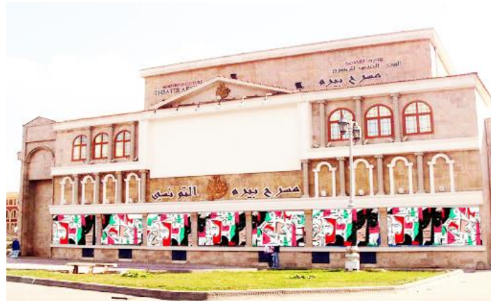
شكل رقم (٣١) جدارية مسرح بيزم التونسى - الاسكندرية

مستوحى من تلخيص الوجوه لكل من ماتيس وبيكاسو فى صياغة تشكيلية مبسطة ،اعتمد العمل فى بناءه على تكوين مجرد يتميز بالبساطة الشديدة ، ويعتمد على مفردة تشكيلية مرنة وقابلة للتحويل والحركة بحرية داخل العمل بأسلوب تجريدى هندسى باختزل الشكل واللون لتحقيق فكرة الإيجاز (Minimality).