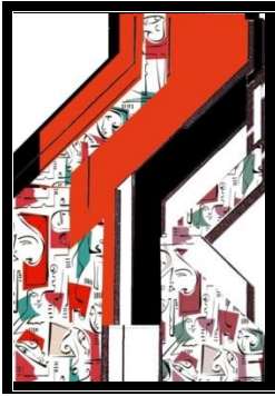
شكل رقم (٣٣)