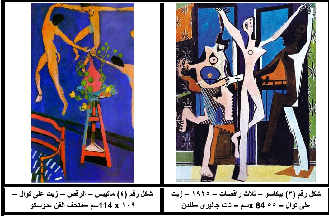
شكل رقم (٤) ماتيسيس - الرقص - زيت على توال - ١٠٩ x 114 سم - متحف الفن - موسكو

خطوط متباينة بين الإستقامة والتعرج مثيرا بذلك التنوع فى ملامحها قدار عاليا من الحيوية فى الشكل، تتوافق ومعنى الرقص.