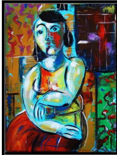
شكل رقم (٢٨) إسم العمل (طلال الإنتظار)، مقياس العمل ١٠x٩٠سم، ألوان زيتية علي توال