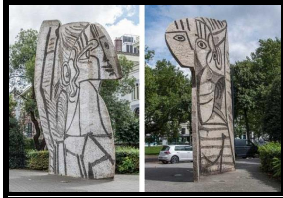
شكل رقم (٢٩)

مجلة العمارة والفنون والعلوم الإنسانية - المجلد السابع - العدد الحادي والثلاثون يناير ٢٠٢٢ عمل مستوحى من خلال القواعد المكتسبة من أعمال بيكاسو في التلخيص والتبسيط الشديد للعناصر الطبيعية الى صور ومساحات هندسية تؤكد على قوة التعبير