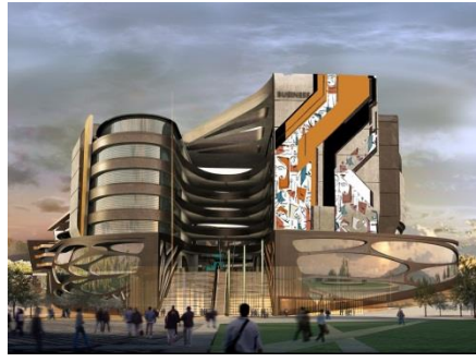
واجهة أرابيلا مول - التجمع الخامس شكل رقم (٣٢)