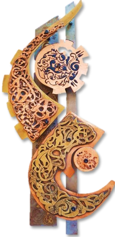
شكل رقم (٩) العمل الثامن

المشغولة استلهمها الطالب من الحروف العربية المعكوسة بصريا فهي أقرب من حرف الجيم او السين المقلوب ، وهذا أسلوب اخر لتحقيق الهيئة الخارجية الي جانب الأشكال الهندسية والعضوية في الاعمال السابقة، واستخدمت حروف خط الثلث بالترابك إلي جانب الزخرفة النباتية لتصنع كتلة تشكيلية من النحاس الأحمر والأصفر تتماشى مع الهيئة العامة للشكل، وتم تفريغها على النحاس الأصفر والأحمر ولكن تم تلوين هذه الفراغات في الجزء العلوي كما واضح في الشكل وتم التأكيد على بعض الحروف من خلال الترميل، كما وضعا عناصر زخرفية نباتية في الدوائر وعولجت بالحفر الكيميائي والتلوين ، اما الشريحتين الصاج الطوليتين فتركا فارغين دون تفاصيل سوي عنصر زخرفي بسيط .