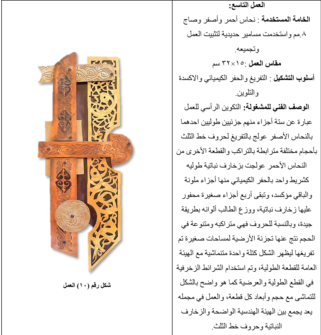
شكل رقم (١٠) العمل