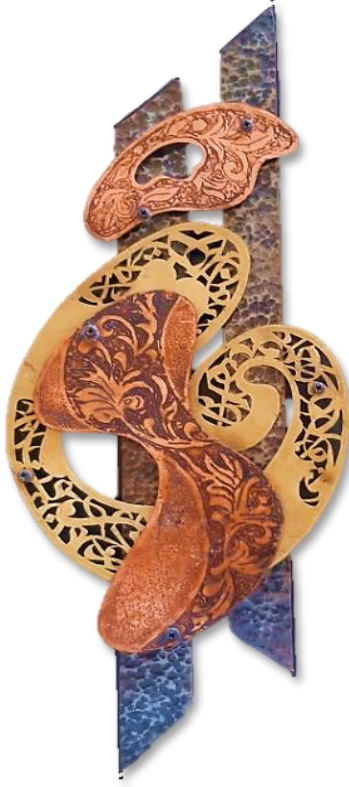
شكل رقم (٤) العمل الثالث

الوصف الفني للمشغولة: العمل مكون من خمسة أجزاء شكلين منهم طويلين شبه منحرفين تقريبا وهما بطول المشغولة من الصاج المطروق، وتم تثبيت الأجزاء بالترتيب كما هو بالعمل، ووزعت الخامات لتحقيق الثراء اللوني وتم تثبيت العمل بمستويات متدرجة بين المرتفع والمنخفض والأمامي والخلفي، يختلف العمل عن سابقه حيث تم الجمع بين حروف خط الثلث مع بعض الزخارف بطريقة انسيابية لتتماشي مع الخطوط الخارجية اللينة وتم تفرغها على قطعة النحاس الأصفر كما هو واضح بالشكل، الي جانب توظيف الزخارف النباتية على قطعتي النحاس الأحمر بطريقة الحفر الكيميائي والأكسدة، واستعان الطالب بأسلوب الترميل كمدخل لتحقيق التباين بين الشكل والأرضية في قطعتي النحاس الأحمر. والشكل في مجمله يعتبر نموذج لتحقيق الانسيابية والمرونة والجمع بين الخطوط الطولية الحادة والخطوط اللينة.