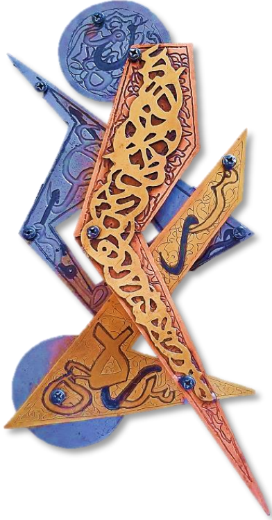
شكل رقم (٣) العمل الثاني

الوصف الفني للمشغولة: العمل عبارة عن ثلاثة أشكال شبه هندسية غير منتظمة تجمعت في تكوين رأسي تعلوه دائرة وتدونه أخرى أصغر، عولجت الاسطح كلها بأشكال زخرفية نباتية اسلامية، وحروف خط التثت التي تراكبت هذه المرة في الشكل الأمامي للعمل وتم تشكيلها بالتفريغ من النحاس الأصفر وحفرت زخارف نباتية في أرضيتها، كما وزعت الحروف على القطعة الخلفية المصنوعة من الصاج محفورة وملونة، وتم تثبيت الأجزاء بالترتيب كما هو بالعمل ووزعت الخامات لتحقيق الثراء اللوني وتم تثبيت العمل بمستويات متدرجة بين المرتفع والمخفض والأمامي والخلفي، كما تم التأكيد باللون الأسود على بعض العناصر الزخرفية النباتية، كما أن الزخارف النباتية اختيرت بشكل يتماشى مع الخطوط الخارجية للأشكال الغير منتظمة.