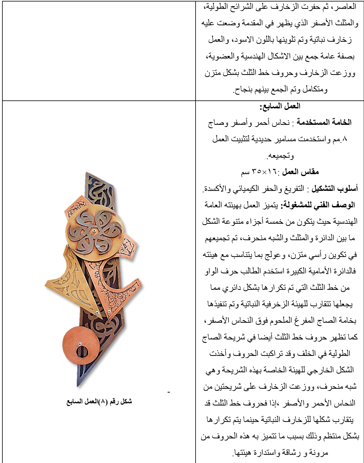
شكل رقم (٨) العمل السابع