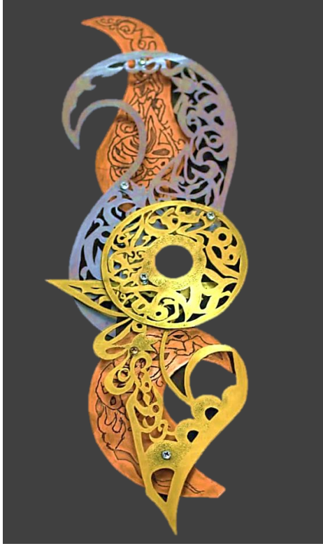
شكل رقم (٦) العمل الخامس