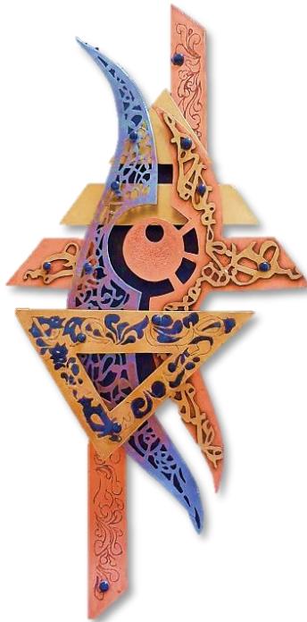
شكل رقم (٧) العمل السادس

الوصف الفني للمشغولة: اعتمد التكوين في مجمله على شكل المثلث فتكرر مقولبا مرة ومعدولا مرة أخرى مع الشكل العضوي الحر بطريقة تتكامل فيها كل أجزاء التكوين، وفي هذا العمل تم تفريغ حروف خط الثلث بالنحاس الأصفر وثبيتها على شريحة من النحاس الأحمر في الجزء الأيمن من العمل، والجزء الأيسر المنفذ من الصاج تم الجمع فيه بين الحروف والزخارف وتم تفريغها فظهر من تحتها باقي