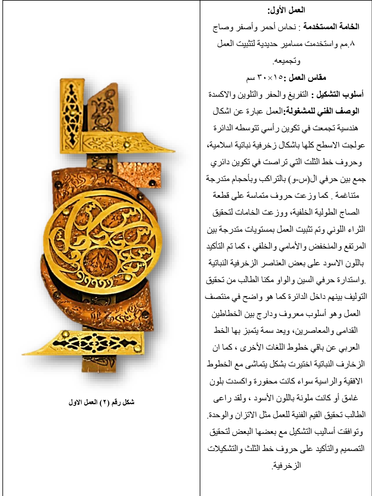
شكل رقم (٢) العمل الاول