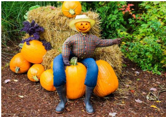
شكل (١٤) خيال المقاته من نشارة الخشب وملابس قماش الريف الأوربي (Carlson 2015)