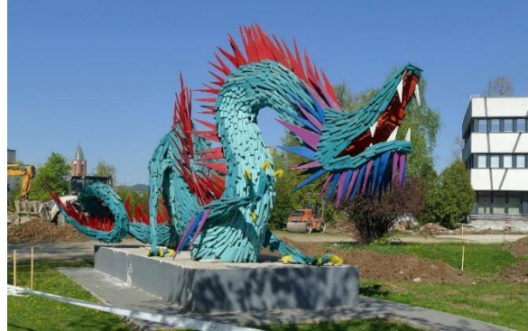
شكل (١٦) التنين الصيني في كازينبارسيكا (Kocsis 2014)