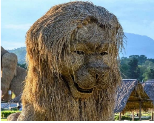
شكل (٩) الأسد - قش ارز - مدينة الملاهي تايلاند - عام ٢٠٢٠