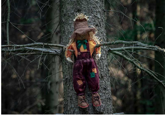
شكل (١٢) خيال المقاته من نباتات جافة وملابس أطفال وقصاصات الاجولة بالغابات الاستوائية