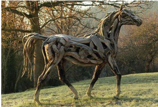
شكل (٢٣) تمثال حصان مصنوع من فروع في حديقة في ريدنغ ، بنسلفانيا (PATOWARY 2010)