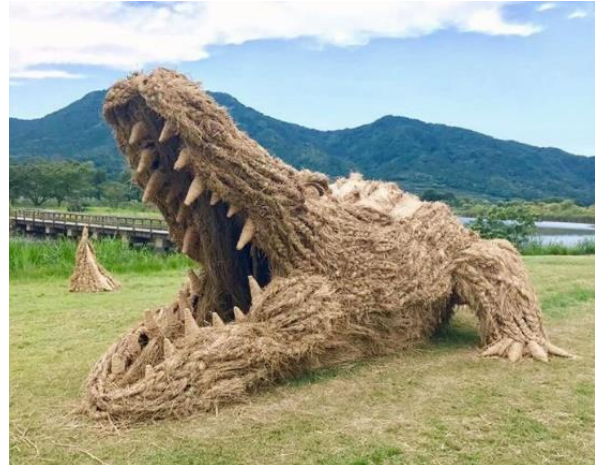
شكل (١) تمساح من القش حديقة واسيغاتا ٢٠٠٦