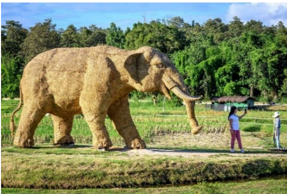
شكل (٧) الفيل - قش ارز - مدينة الملاهي تايلاند - عام ٢٠٢٠

منحوتات عملاقة من قش الأرز في مدينة الملاهي بتايلاند تحتوي الحديقة على منحوتات من قش الأرز بالحجم الطبيعي - الغوريلا شكل (٦)، والفيل شكل (٧)، والخنزير البري شكل (٨)، والأسد شكل (٩)، والغزلان شكل (١٠).