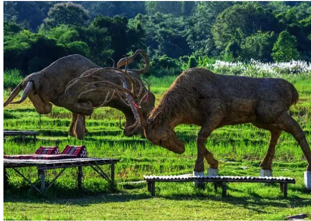
شكل (١٠) مجموعة من الغزلان - قش ارز - مدينة ملاهي تايلاند ٢٠٢٠م (Agencies 2020)

من خلال عرض الباحثة لنماذج من المنحوتات المنفذة من خامة قش الارز، والتي تنوعت في موضوعاتها واشكالها وحركاتها واولواعها ، يلاحظ ان الاعمال تحقق قيما جمالية حيث احتوت كل منها على الوحدة في التصميم ن كما حقق النحات الاتزان والنسبة والتناسب في العمل ، هذا اضافة الى تحقيق الفنان للظل والنور واختلاف الملامس في كل منها ، وجدير بالذكر ان المنحوتات التي تحاكي الطبيعة بما فيها من حيوانات ونباتات واشكال ادمية ، يتحقق بها جميع القيم الجمالية حيث انها مستوحاه من مخلوقات تنسم بالقيم الجمالية ، ويقوم النحات باختيار الحركات والاولواع التي تؤكد ذلك .