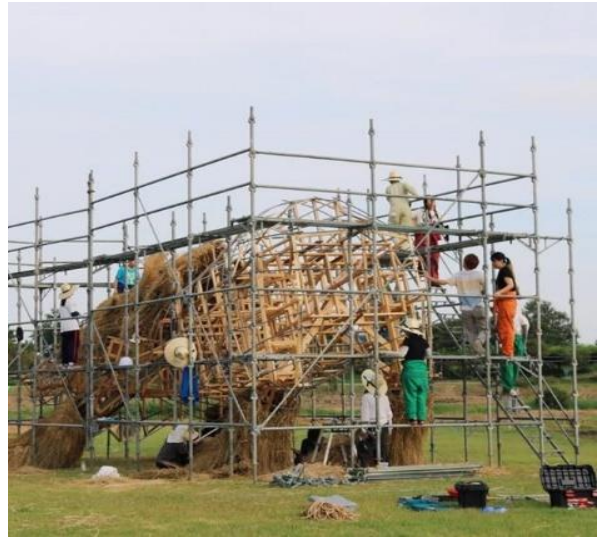
شكل (٥) تصميم وتنفيذ أحد الهياكل

منحوتات عملاقة من قش الأرز في مدينة الملاهي بتايلاند تحتوي الحديقة على منحوتات من قش الأرز بالحجم الطبيعي - الغوريلا شكل (٦)، والفيل شكل (٧)، والخنزير البري شكل (٨)، والأسد شكل (٩)، والغزلان شكل (١٠).