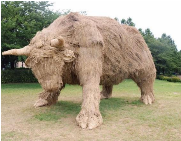
شكل (٢) ثور من القش حديقة واسيغاتا ٢٠٠٦

وفى شكل (٤،٣،٢،١) يتضح طريقة تنفيذ الاعمال واستخدام السقالات في شكل (٥) (JOHNNY 2017)