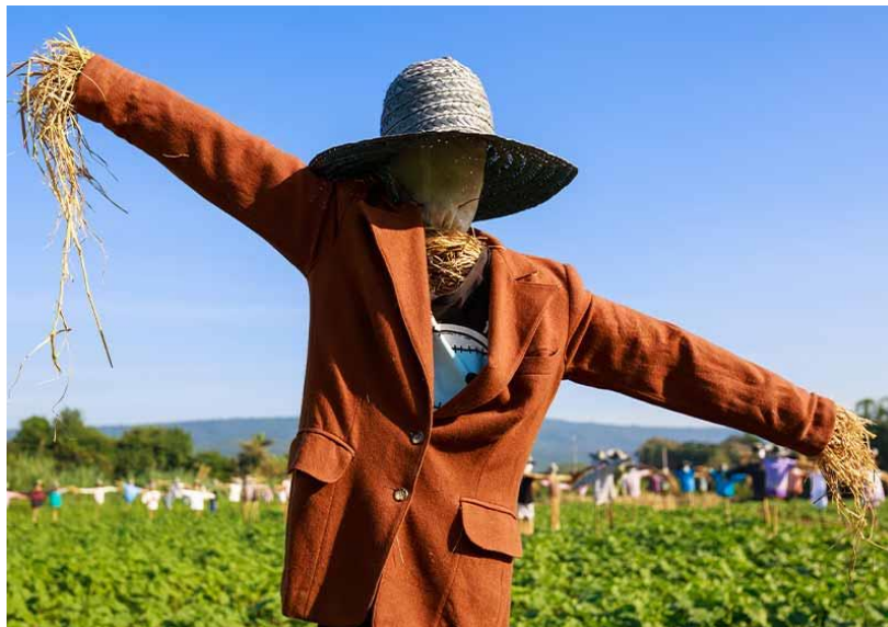
شكل (١٥) خيال المقاته ذات القبة - من القش - ملابس من القماش (Carlson 2015)

حيث استخدم الفنان خامات مختلفة مثل القش والقماش واخشاب الأشجار والحبال، بغرض عمل مجسمات تستخدم كألعاب لأتارة الرعب احيانا وهذا ما يبحث عنه الكثيرون في بعض مناطق الالعاب ومدن الملاهي، واخرون يستخدمونها لحراسة الحقول والزراعات واخرون يستخدمونها في عيد الهالوين قبة جميلة إكليل الفزاعة كما هو في الشكل (١٥).