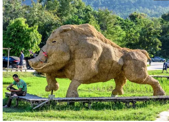
شكل (٨) خنزير برى - قش ارز - مدينة ملاهي تايلاند ٢٠٢٠