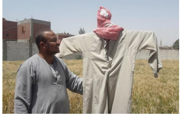
شكل (١١) خيال المقاته الموروث المصري من العصي وجلباب من القماش بالريف المصري