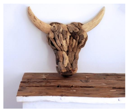
شكل (٢٢) رأس جاموس دريفتوود ، ديكو حائط من الخشب الطافي

وفي شكل (٢٤) تقنية اخرى لتنفيذ منحوتات بروسيا عمل الفنان الروسي سيرجي بوركوف Sergey من خلال رقائق خشب الارز، حيث تتكون من حوالي ١٠٠ إلى ١٥٠ من الرقائق الخشبية جمعت بطول ٢-٣ بوصة طولية ، وقد أوضح المصمم أنه يضع عمله في الماء لعدة أيام، وهو يستخدم الدقة المتناهية كأنه يقوم بعملية جراحية دقيقة، وقد قدم هذا الفنان