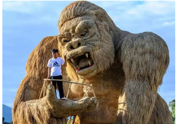
شكل (٦) الغوريلا - قش ارز - مدينة الملاهي تايلاند - عام ٢٠٢٠