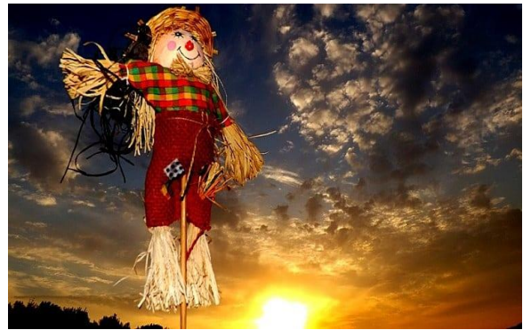
شكل (١٣) خيال المقاته من القش ولحاء الأشجار وبعض قطة القماش في شرق أوروبا

حيث استخدم الفنان خامات مختلفة مثل القش والقماش واخشاب الأشجار والحبال، بغرض عمل مجسمات تستخدم كألعاب لأتارة الرعب احيانا وهذا ما يبحث عنه الكثيرون في بعض مناطق الالعاب ومدن الملاهي، واخرون يستخدمونها لحراسة الحقول والزراعات واخرون يستخدمونها في عيد الهالوين قبة جميلة إكليل الفزاعة كما هو في الشكل (١٥).