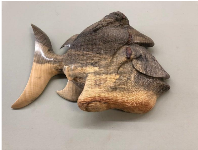
شكل (٢١) من أعماق البحار من خشب البلوط Slyder سلايدر

وفي شكل (٢٣) مجسم الحصان وقد تم تنفيذه من فروع الأشجار، في بنسلفانيا Kraft Candy عام ٢٠١٢م