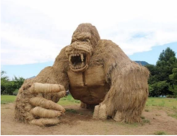
شكل (٤) غوريلا من القش حديقة واسيكيغاتا ٢٠٠٦