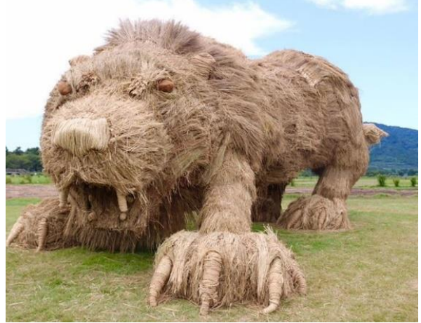
شكل (٣) أسد من القش حديقة واسيكيغاتا ٢٠٠٦