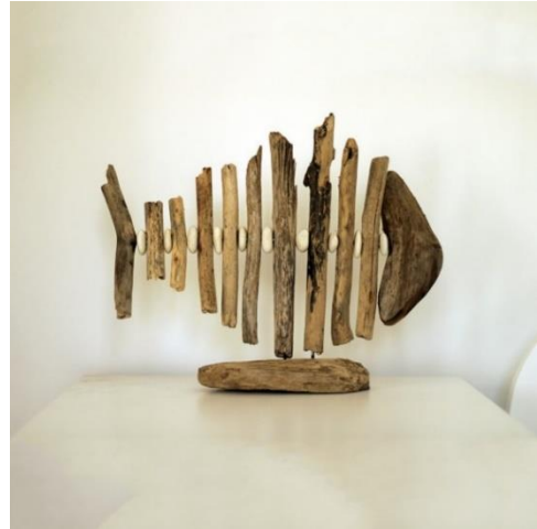
شكل (٢٠) أسماك - أخشاب - الحصى ونحت الخشب