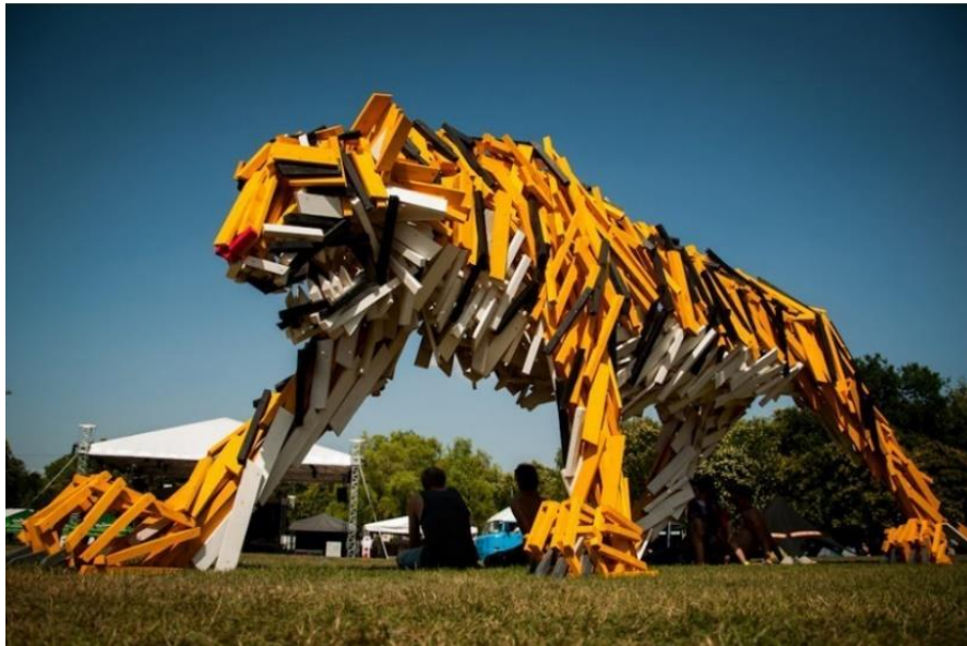
شكل (١٨) مجسم يمثل النمر من نفايات الأخشاب المُعاد استخدامها والصديقة للبيئة (Kocsis 2014)

كما توجد العديد من اعمال الفنان فيرينكفاروس Ferencvaros في العديد من دول العالم فعلى سبيل المثال شكل (١٨) مجسم يمثل النمر في مدسنة هوجرين والتي تشتهر بمناظرها الطبيعية، صُنعت منحوتات الفنان من نفايات الأخشاب المُعاد استخدامها والصديقة للبيئة، وتم عرضها في العديد من الأماكن من ميلانو إلى واشنطن، وحتى في روسيا. قد تجد أعماله الفنية في مدن مثلاً Hungarian أيضاً، على سبيل المثال، حيث يمثل تمثال النمر الخاص به جزء من المناظر الطبيعية الحضرية Szakacsi، وهي بلدة تعد من بين أفقر المدن في البلاد.