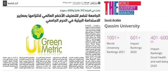
شكل (١٣): يمين (الجامعة تحصل على الترتيب ١٠٠١ على المستوى العالمي في التصنيف الدولي لهيئة التاييمز الدولية لعام ٢٠٢٠. يسار (بيان إنضمام الجامعة للتصنيف الأخضر - UI Green Metric - لإلتزامها بمعايير الإستدامة البيئية داخل الحرم الجامعي، يسار: منحة واعد لأعضاء هيئة التدريس الجدد).

وضع خطة إستراتيجية للبحث العلمي والإبتكار تهدف إلى (تحسين صحة الإنسان وجودة الحياة - تحقيق الإستفادة من الموارد الطبيعية للمنطقة).