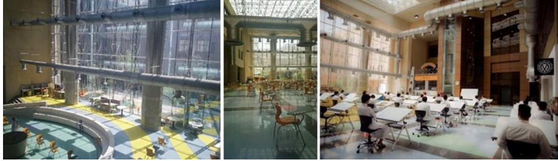
شكل (٣١): تصميم كثير من الفراغات الداخلية بطرق مستدامة تساعد على دخول الضوء الطبيعى إلى الفراغات أثناء فترات الدوام، خاصة فى الكليات التطبيقية مثل كلية العمارة والتخطيط، وكلية الهندسة، وذلك بإستخدام الحوائط الستائرية المطلة على أفنية داخلية، لتقليل التعرض المباشر لإشعة الشمس، خاصة فى فصل الصيف.