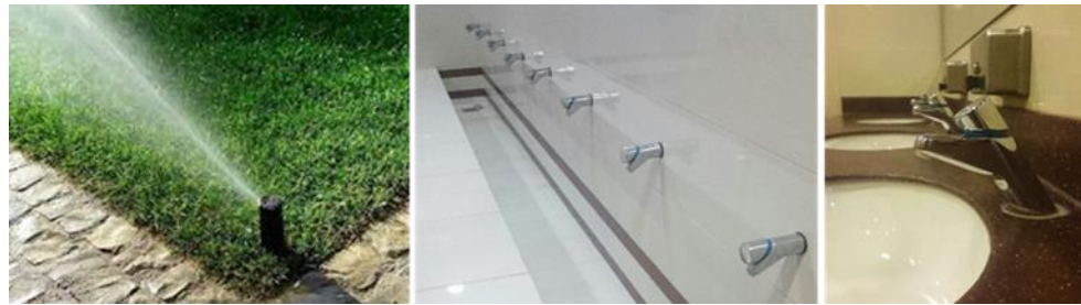
شكل (5): يمين، وسط (صنابير المياه الموفرة، والتي تستخدم في كافة دورات المياه، وأماكن الوضوء بالحرم الجامعي)، يسار (أحد تقنيات الري الذكي بالغمر داخل الحرم الجامعي).

يجب التعامل مع المياه داخل الحرم الجامعي خاصة في المناطق الصحراوية بطرق تحقق الترشيح والحفاظ على مصادر المياه. وقد قامت جامعة القصيم باستخدام تقنيات الري الذكي بالغمر لجميع المسطحات الخارجية للحرم الجامعي، الذي لا يخرج بعيداً عن حواف المنطقة الخضراء وبالتالي يقلل الهدر، كذلك الحد من إستهلاك المياه المستخدمة في المساجد وجميع دورات المياه بالجامعة، باستخدام صنابير المياه المعتمدة المرشده جدا للإستخدام كما بالشكل ٥.