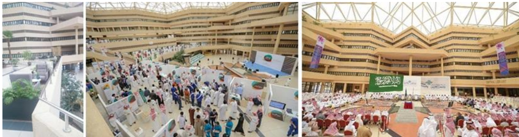
شكل (٣٢): مرونة الإستخدام رفراغ البهو الرئيسى بحرم جامعة القصيم.

تُعرّف مرونة المباني المادية بأنها سهولة التوسع الأفقي، وسهولة التكيف لإيجاد وظائف فراغية جديدة أو السماح بتعدد الوظائف لنفس الفراغ، كما ذكر في العديد من التعاريف مثل ما ذكره (Monahan, 2002) (22) بأن المرونة المادية تشير إلى قابلية تعديل الفضاء لممارسات الأفراد، وذلك لتلبية الإحتياجات الحسية و/ أو الحركية الخاصة بالطلاب، مثل الأثاث والجدران المنقولة، أو المباني التي يمكن إعادة تكوينها، كذلك الغرف والممرات. وقد تم التأكيد على المرونة في المباني بوضوح كما ذكر سابقاً، من خلال أراضى الحرم التي تسمح بسهولة التوسع المستقبلي، كذلك التصاميم المختلفة لكثير من الفراغات داخل الحرم مثل البهو الرئيس الذي يستخدم لأكثر من نشاط.