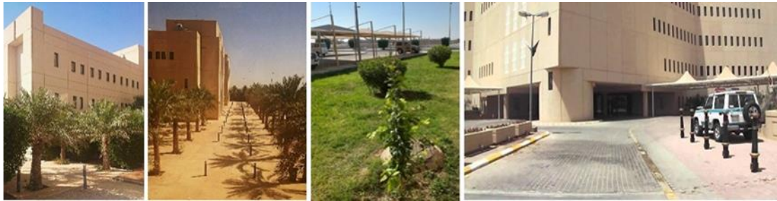
شكل (٢٦): بعض ممارسات وتجهيزات البنية التحتية بحرم جامعة القصيم.

الشكل الثانية يعرض شبكة طرق الحرم الجامعي بما في ذلك أنظمة الصرف، الغرس، والإنارة التي تعد من أهم مشاريع البنية التحتية التي تشيد في الحرم الجامعي المستدام (21).