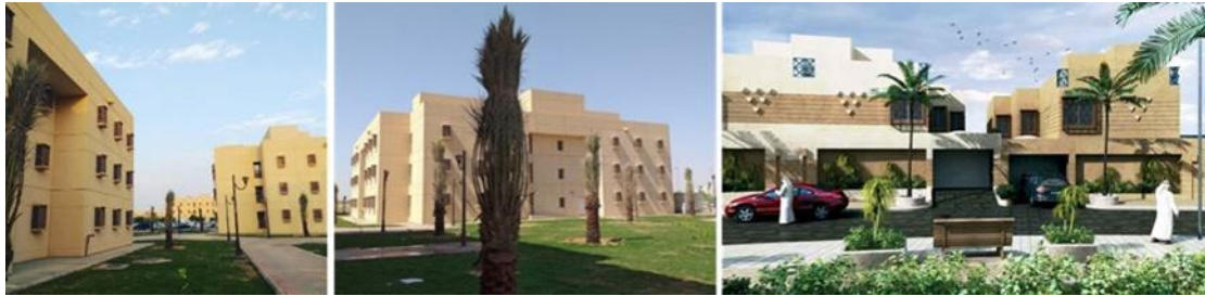
شكل (١٠): يمين (سكن أعضاء هيئة التدريس بحرم جامعة القصي - تحت الإنشاء)، وسط، يسار (سكن الطلاب الجامعي)

المؤسسات الجامعية الكبيرة يجب ان تشمل مبانيها على سكن خاص بالطلاب المغتربين، وكذلك أعضاء هيئة التدريس الأجانب، وجامعة القصيم خصصت مجموعة من المباني للطلاب المغتربين والجانب داخل الحرم الجامعي، بالإضافة على مجموعة أخرى لسكن أعضاء هيئة التدريس وهي الآن في مرحلة التشطيبات الداخلية.