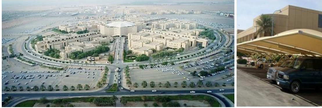
شكل (٢٢): يمين: بعض الأماكن المخصص لأعضاء هيئة التدريس، يسار: حرم الجامعة وبه الكثير من الأراضي المخصصة لمواقف للسيارات الخاصة. المصدر: الباحث - Google Chrome.

تم تخطيط أرض الحرم الجامعي بمجموعة متنوعة من الطرق الخاصة بالسيارات، والمشاه، إلا أن فكرة استخدام الدراجة في التنقل ما زالت بعيدة عن المجتمع القصيمي، في ظل توفر الإمكانيات المادية، ولكن الطرق الحالية جيدة بالقدر الكافي الذي يسمح بحديد أماكن سير الدراجات في المستقبل، وقد تم إقامة أكثر من فاعلية لتشجيع الطلاب والمجتمع القصيمي على ذلك.