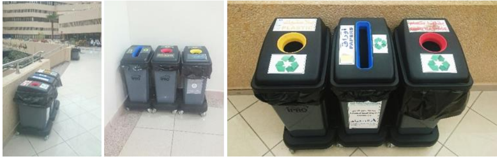
شكل (٤): صناديق فصل المخلفات (أوراق، بلاستيك، وبقايا طعام).

إنبعثات النفايات الصلبة: يتم التعامل مع النفايات الصلبة بطرق مستدامة آمنة خارج مباني الحرم الجامعي وداخلة، كما بالشكل ٤.