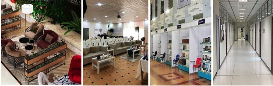
شكل (٣٣): المرونة باستخدام القواطع الانفصالية بين الفراغات، وكذلك دمج الأثاث الثابت مع المتحرك في فراغات حرم القصيم الجامعي.