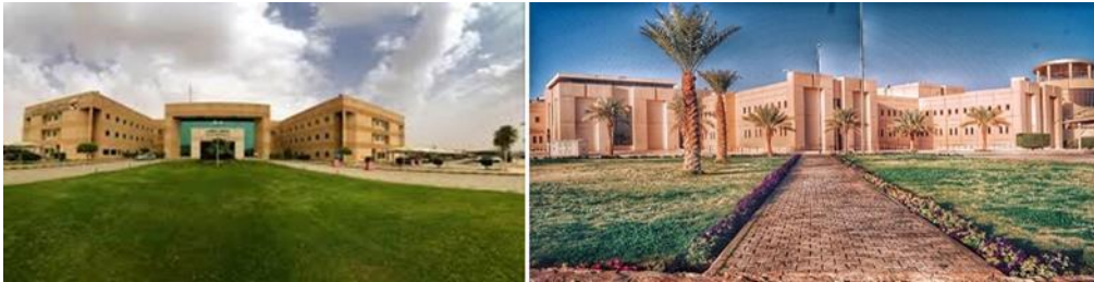
شكل (١٢): بعض المسطحات الخضراء بحرم جامعة القصيم، المصدر: Google Chrome.

من شروط الإستدامة الجامعية أن يحتوى الحرم الجامعى على مسطحات خضراء تعزز من رواج فكرة الإستدامة داخله. وقد أولت الجامعة إهتماما كبيرا بهذا الأمر، على الرغم من كون التربة صحراوية، كما بالشكل ١٢