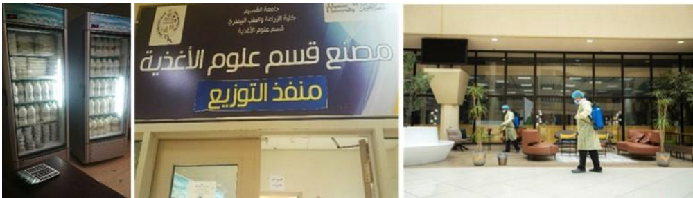
شكل (٧): يمين (عمال الجامعة أثناء عمليات التعقيم الدورية)، وسط، يسار ( أحد منافذ بيع المنتجات الغذائية التابع لكلية الزراعة بحرم جامعة القصيم).