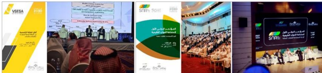
شكل (١٥): يمين: فعاليات مؤتمر إستدامة الموارد الطبيعية، يسار: مؤتمر أفاق الطاقة الشمسية. المصدر: الباحث - Google Chrome.

قائمة أول مؤتمر دولي للإستدامة تحت عنوان (إستدامة الموارد الطبيعية - الإدارة المستدامة للنفايات الصلبة) في الفترة من ٦-٥ نوفمبر ٢٠١٩م، ومؤتمر (أفاق الطاقة الشمسية)، في الفترة من ١-٢ أبريل ٢٠٢٠م.