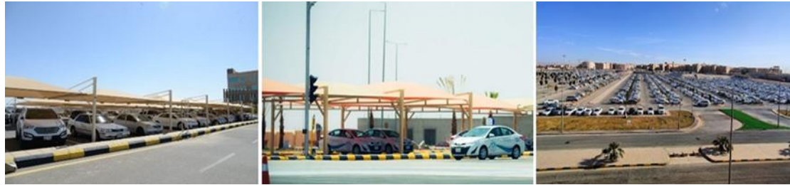
شكل (٩): يمين (مواقف سيارات الطلاب)، وسط (مواقف الطلاب الخاصة بمدرسة تعليم القيادة للسيدات بالحرم)، يسار (مواقف أعضاء هيئة التدريس بالجامعة)

المجتمع السعودي عامة والقصيمي خاصة يعتمد بشكل كبير على السيارات الخاصة، لذلك تم توفير الكثير من المناطق كمواقف للسيارات، بعضها مظلّل والأخر يتم تظليله على مراحل زمنية متعاقبة كما بالشكل ١٥. وهذا بالقطع يشجع كثير من الطلاب وأعضاء هيئة التدريس والعاملين بالجامعة على استخدام سياراتهم الخاصة بدلاً من وسائل أخرى أكثر إستدامة.