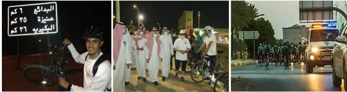
شكل (٢٣): مبادرة جامعة القصيم لتعظيم فكرة استخدام الدراجات في التنقل، كخطوة أولى للتقليل من الاعتماد على السيارات الخاصة.

تم تخطيط أرض الحرم الجامعي بمجموعة متنوعة من الطرق الخاصة بالسيارات، والمشاه، إلا أن فكرة استخدام الدراجة في التنقل ما زالت بعيدة عن المجتمع القصيمي، في ظل توفر الإمكانيات المادية، ولكن الطرق الحالية جيدة بالقدر الكافي الذي يسمح بحديد أماكن سير الدراجات في المستقبل، وقد تم إقامة أكثر من فاعلية لتشجيع الطلاب والمجتمع القصيمي على ذلك.