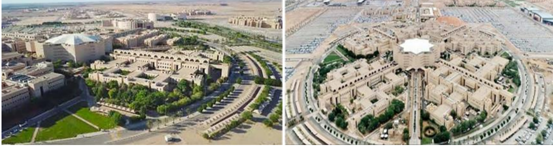
شكل (١): حرم جامعة القصيم - بمدينة المليداء.

حرم جامعة القصيم هو الموضوع الرئيسي للبحث. هذا لأنه يعد الأكبر مساحة والأكثر من حيث عدد الكليات والطلاب به، فهو يضم العديد من المجالات التعليمية، البحثية، الإجتماعية، بالإضافة على المرافق الرياضية، ومباني سكن أعضاء هيئة التدريس والطلاب.