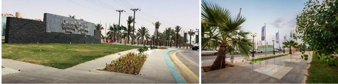
شكل (٢٥): أحد مداخل وبوابة حرم القصيم الجامعي.

الشكل الأول يظهر البوابة الرئيسية لحرم جامعة القصيم، وعلى الرغم من كونه نقطة رمزية إلا أنها تتحكم في الوصول إلى الحرم الجامعي. وهي من أوائل مشاريع البنية التحتية التي تم بناؤها، وقد قدمت كلية العمارة والتخطيط العديد من المقترحات بغرض إقامة بوابة أكبر تليق بقيمة ومكانة جامعة القصيم، وهي تدرس الآن من قبل متخذي القرار لأختيار أفضلها للتنفيذ.