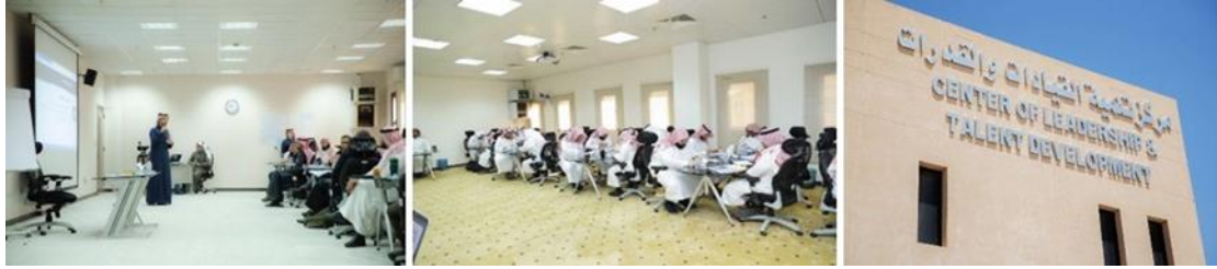
شكل (١٨): يمين: مقر مركز تنمية القيادات والقدرات، يسار: فاعليات أحد الدورات الخاصة بإعداد أعضاء هيئة التدريس الجدد بالجامعة سواء من كليات الحرم الجامعي، أو من فروع الجامعة الأخرى بالقصيم.

تقدم الجامعة بشكل مستمر العديد من الدورات سواء الحضورية، أو عن بعد في ظل الظروف الحالية. حيث تشتمل الجامعة على مركز تنمية القيادات والقدرات، وهو المسؤول عن عقد وتنظيم هذه الدورات والندوات.