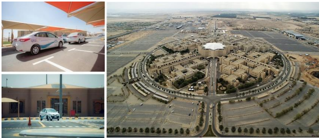
شكل (٢٤): جاهزية الطرق داخل حرم القصيم الجامعي.

ملاحظة أخرى للتخطيط هي تصميم وجاهزية الطرق داخل حرم جامعة القصيم. يوضح الشكل ٢٤ دقة وجاهزية الطرق للإستخدام، بما في ذلك العلامات المرورية والإرشادية التي تزين بداية من البوابة الرئيسية للجامعة، والتنقل بين أجزائها المختلفة، وصولاً إلى المباني الجديدة التي ما زالت تحت الإنشاء. ما يجعل الحرم الجامعي أكثر ملاءمة للإستخدام أو السير بشكل آمن ومريح.