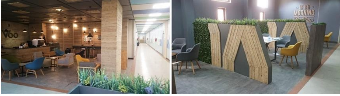
شكل (٢٩): (إستخدام تقنية زراعة بعض الحوائط الداخلية)، يسار: (زيادة الفراغات الخدمية الحديثة، والعناصر الخضراء الداخلية لزيادة حميمية المكان لمستخدمية). المصدر: الباحث

كما قام المعمارى كينزو تانج - Kenzo Tang بتعظيم مفاهيم العمارة المستدامة، ونقل الإحساس الدائم بهوية المكان من خلال الممرات الكثيرة المضاءة طبيعياً، والمصممة بطرق عربية مثل العقود المتقاطعة، أو غربية متقدمة مثل الأسقف المعدنية، والواجهات الداخلية الزجاجية، كما هو موضح بالأشكال التالية.