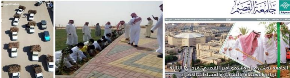
شكل (٦): يمين (مبادرة الجامعة لزيادة الإهتمام بالتشجير فى القصيم)، وسط (مشاركة الجامعة وطلاب أحد المدارس بالقصيم فى تشجير القصيم)، يسار (حافلات نقل الشجيرات إلى مناطق زراعتها فى القصيم).