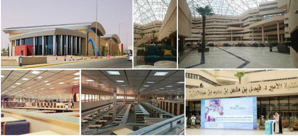
شكل (١١): أعلى يمين، وسط (البهو الرئيسى لحرم الجامعة - ساحة القبة) أعلى يسار (مبنى صالة الألعاب) المصدر: الباحث أسفل (مكتبة الأمير فيصل بن مشعل المركزية بحرم الجامعة)، المصدر: Google Chrome.

يجب أن تشجع مبانى الحرم الجامعى الطلاب، والعاملين بها على زيادة المشاركة الحيوية. وجامعة القصيم قد أعدت لذلك العديد من المباني والأماكن الكبيرة التى تحقق ذلك مثل بهو الجامعة الكبير، المكتبة المركزية، وصالة الألعاب الرياضية.