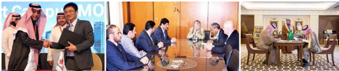
شكل (١٧): توقيع إتفاقية التعاون المشترك مع أكاديمية الأمير أحمد بن سلمان للإعلام التطبيقي، وسط: توقيع إتفاقية التعاون المشترك مع جامعة متشجن، يسار: التعاون المشترك بين الجامعة وموسسة هواوى التقنية.

تشارك الجامعة في العديد من الإتفاقيات والشراكات على المستويين المحلي والدولي، مثل مشاركة الجامعة وطنياً مع أكاديمية الأمير أحمد بن سلمان للإعلام التطبيقي، وعلى الصعيد الدولي الشراكة مع جامعة متشجن لتبادل الخبرات في مجالات التعليم العالي والبحث العلمي، وايضا الشراكة مع شركة هواوى الدولية لتطبيق بعض المشاريع التقنية داخل الجامعة.