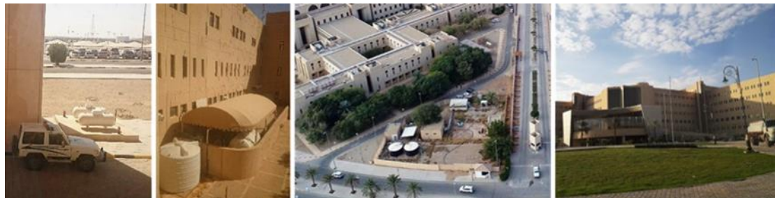
شكل (٢٧): خزانات المياه المتفرقة في جنبات حرم جامعة القصيم.

الشكل الثالث يوضح مصادر المياه التي توفرها خزانات الحرم الجامعي، حيث تم بناء خزانات للمياه في أماكن متفرقة من جنبات الحرم الجامعي، حيث يتم نقل المياه إليها بالطرق المعهودة في المملكة عن طريق سيارات الشركات التي تعاقده معها الجامعة لنقل المياه كما بالشك، حيث أن مصادر المياه العذبة قليلة في القصيم، شأنها في ذلك شأن جميع مناطق المملكة.