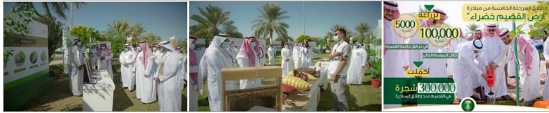
شكل (١٦): المرحلة الخامسة من مبادرة جامعة القصيم لزيادة المساحات الخضراء في القصيم.

مشاركة الجامعة في مبادرة "أرض القصيم خضراء" لزراعة ١٠٠٠ شتلة في مواقع مختلفة كالمدراس والحدائق.