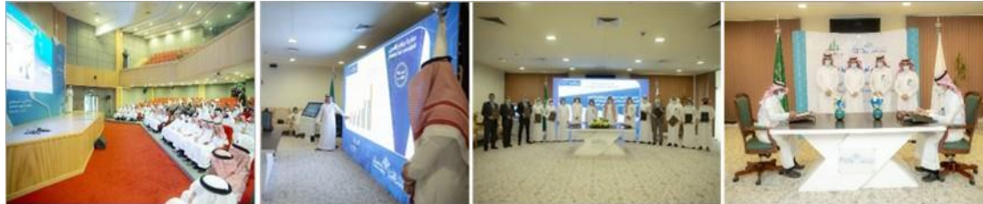
شكل (١٤): يمين: فعاليات تدشين الجامعة المرحلة الأولى من إستراتيجية البحث العلمي. يسار: تكريم الفائزين بجوائز للبحث العلمي تقدر بنصف مليون ريال سعودي. المصدر: Google Chrome.

الموافقة على المشاريع البحثية التي تهتم بشئون البيئة والممولة من وزارة التعليم، وقد قامت جامعة القصيم بتدشين المرحلة الأولى من إستراتيجية البحث العلمي هذا العام، وتوقيع المشاريع البحثية الممولة من مبادرة وزارة التعليم، من خلال توقيع الجامعة ١١ مشروعاً بحثياً، ضمن مبادرة دعم البحث العلمي والتطوير في الجامعات التي طرحتها الوزارة ممثلة بوكالة البحث والإبتكار وفق رؤية المملكة ٢٠٣٠م.