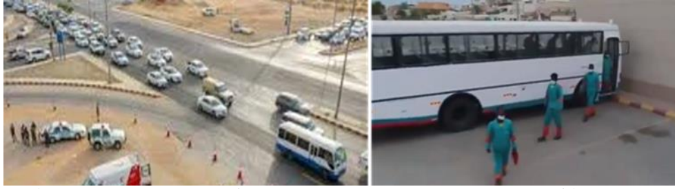
شكل (3): يمين (عمال الجامعة أثناء وصولهم إلى مقر الحرم الجامعي بالمليداء)، يسار (أحد حافلات النقل الجماعي المتجهة على طريق الملك عبد العزيز إلى الحرم الجامعي).

إنبعثات النفايات الصلبة: يتم التعامل مع النفايات الصلبة بطرق مستدامة آمنة خارج مباني الحرم الجامعي وداخلة، كما بالشكل ٤.