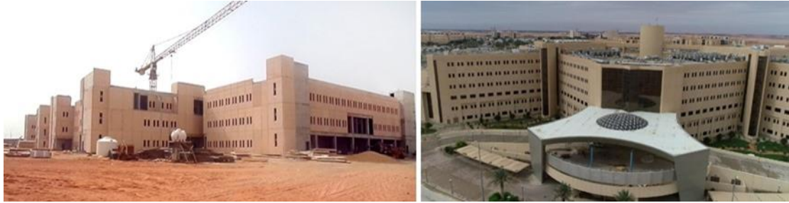
شكل (٨): يمين (مبنى مستشفى جامعة القصيم الجديدة)، يسار (مجمع الكليات الطبية بحرم جامعة القصيم)

تضم الحرم الجامعي العديد من المنشآت التعليمية الجيدة، سعيًا من الجامعة بفتح أقسام جديدة للطلاب مثل قسم التصميم التابع لكية العمارة والتخطيط، بالإضافة إلى مجموعة من المباني الخدمية مثل مستشفى جامعة القصيم الجديدة، مبنى المؤتمرات الجديد، ومجمع الكليات الطبية.