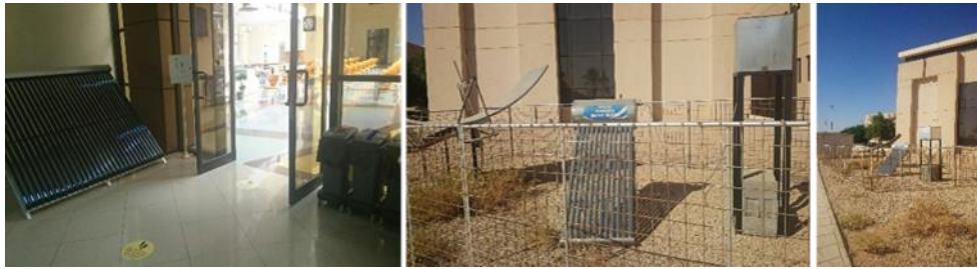
شكل (٢): (يمين، وسط (أحد الخلايا الشمسية المستخدمة في الحرم الجامعي)، يسار (أحد المشاريع الشمسية)).

حياد الحرم الجامعي الكربوني يتحقق بمراعات (الإستراتيجيات المستخدمة لإستهلاك الطاقة، التعامل المستدام مع النقل، وكذلك تقليل انبعاثات النفايات الصلبة). وفي حرم جامعة القصيم تم التعامل مع هذه المحددات كما يلي: إستهلاك الطاقة: قامت الجامعة بإنشاء بعض الخلايا الشمسية في أماكن متفرقة من الحرم الجامعي، كذلك تشجيع الطلاب على تصميم مثل هذه الخلايا والمشاركة بها في المسابقات الدولية.