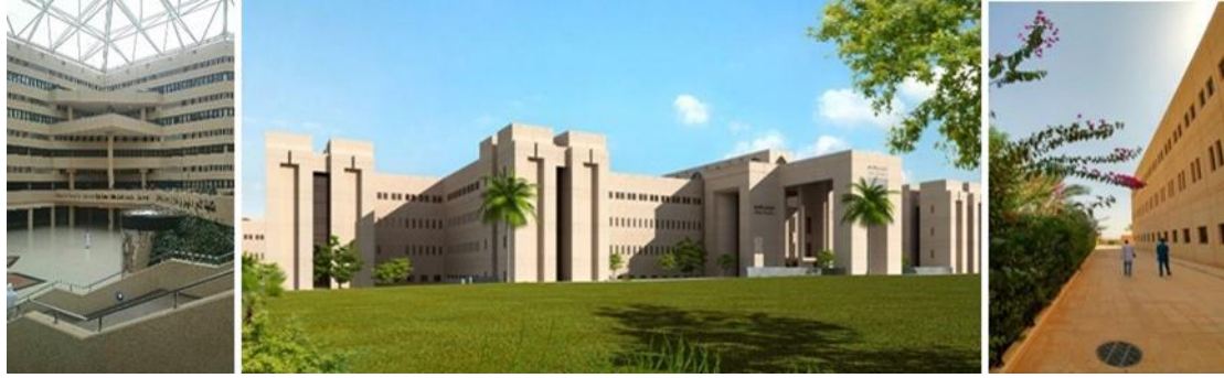
شكل (٢٨): مراعاة الجانب البيئي عند تصميم حرم جامعة القصيم.

طورت جامعة القصيم العديد من الممارسات المعمارية للحرم الجامعي للمساعدة في تحسين الجوانب البيئية للاستدامة وتقليل الاستهلاك الكلي للموارد؛ بما في ذلك الطاقة المجددة، الطاقة التشغيلية، ومواد البناء، وهذا ما نصت عليه بوضوح في رؤيتها الداعمة للتنمية المستدامة، والمساهمة في بناء مستقبل المعرفة، ومن هذه الممارسات ما يلي: