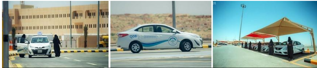
شكل (٢٠): مبادرة الجامعة بإنشاء مدرسة لتعليم القيادة للسيدات بحرم الجامعة ٣,٥ الإستدامة البيئية: وتشمل - الموقع الوصلية، والاعتبارات المناخية، والمرونة، وإستخدام الفضاء