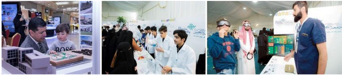
شكل (١٩): يمين: مبادرة كلية الطب لخدمة المجتمع، وسط: نشاط كلية صيدلة لخدمة المجتمع، يسار: معرض كلية العمارة والتخطيط لخدمة المجتمع. المصدر: الباحث - Google Chrome.

تقدم الجامعة الكثير من الأنشطة والفاعليات التي تهتم بخدمة المجتمع بشكل عام، وبالصحة وجودة الحياة على وجه التحديد، مثل المبادرات التي قامت بها كليات الطب، الصيدلة، الأسنان، العمارة والتخطيط لخدمة المجتمع.