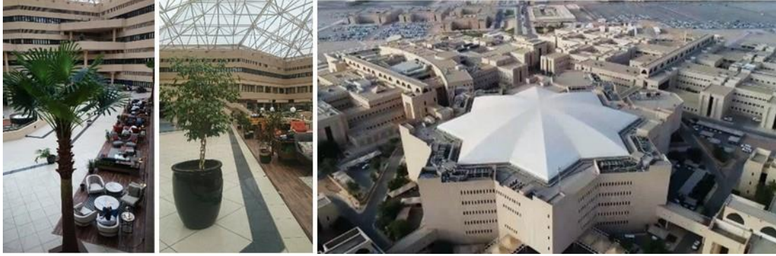
شكل (٣٠): تصميم البهو الرئيسى على شكل ثمانى للحفاظ على الهوية المحلية، بالإضافة إلى إستخدام التقنيات الحديثة فى تصميم السقف المعدنى المنفذ للضوء للحفاظ على الطاقة.

كما قام المعمارى كينزو تانج - Kenzo Tang بتعظيم مفاهيم العمارة المستدامة، ونقل الإحساس الدائم بهوية المكان من خلال الممرات الكثيرة المضاءة طبيعياً، والمصممة بطرق عربية مثل العقود المتقاطعة، أو غربية متقدمة مثل الأسقف المعدنية، والواجهات الداخلية الزجاجية، كما هو موضح بالأشكال التالية.