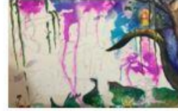
مراحل تنفيذ الوسائط المختلطة - نوران الحجازي