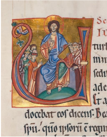
شكل (٦) صفحة مذهبة من مخطوط إيطالي حوالي ١٤٤٠

وتطورت صناعة الألوان وأصبحت أكثر كثافة ونقاء، وتميزت الرسوم بألوان مشرقة، حيث كانت الألوان توضع علي شكل طبقات للحصول علي ألوان قوية زاهية. وظهرت الألوان المعدنية البراقة، كالذهبية والفضية و الألوان المستخرجة من الأحجار الكريمة، كأزرق اللازورد، مما أضفي علي المخطوطات مظهر السمو والفاخرة. كذلك أضافت رقائق الذهب بعدًا جماليًا وتعبيريًا لن يتكرر مرة أخرى علي الإطلاق، وهو واحدًا من أهم أسباب ارتفاع قيمة وشأن المخطوطات حتي الآن شكل (٦).