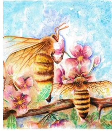
شكل (١٦) عالم النحل- إيمان فتوح -٢٠١٧