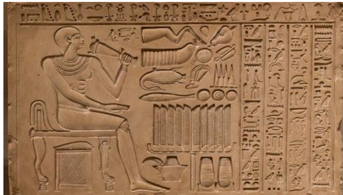
شكل (٥) رسم توضيحي لمصاحب لنص - حفر غانر - الحضارة المصرية القديمة

تطورت أسطح الرسم في معظم الحضارات القديمة، وانتقل الإنسان من الرسم والتلوين على جدران الكهوف الخشنة إلى الكتابة والرسم على جدران المعابد المستوية، وظهرت ألواح من خامات وأحجام مختلفة، كالألواح الطين والخشب والعاج والمعادن وغيرها، وتتنوع أدوات الرسم والتلوين لكي تناسب الأسطح الجديدة، ونفذت الرسوم بتقنيات متنوعة سواء بالرسم والتلوين أو الطباعة أو الحفر المجسم، شكل (5).