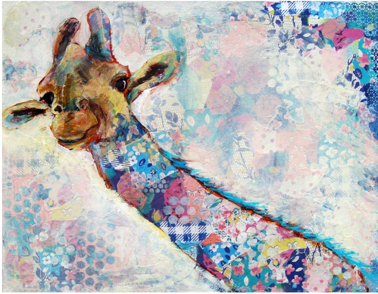
شكل (١٤) رأس زرافة بالوسائط المختلطة

مما سبق، يمكننا تعريف الوسائط المختلطة بأنها واحدة من الفنون التي تجمع بين أكثر من وسيط، كالدمج بين خامات مختلفة (باستيل، ألوان مائية، أقلام وغيرها) ، كذلك الدمج بين أنواع مختلفة من الفنون (كفنون الطباعة print making مع فنون التلوين painting وفنون القص واللصق collage)، لذلك يُعد مصطلح الوسائط المختلطة مصطلحًا شاملاً، مما يعطي مساحة واسعة من الحرية والتعبير في إنشاء أعمال فنية بارزة مميزة bold works of Art . (٢٤).