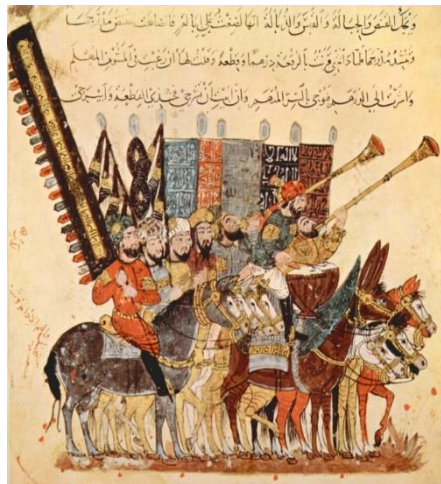
شكل (١) رسوم إيضاحية "للواسطي" جنوب العراق - القرن ١٣

المقامات نوع من القصص القصيرة، تعتمد على السجع وتحفل بالحركة التمثيلية، وصور الرسام يحيى بن محمود الواسطي (خطاط ورسام عراقي ومؤسس مدرسة بغداد لتصوير المنمنمات) حوالي خمسين قصة قصيرة، كتبها المؤلف العراقي أبو محمد القاسم بن علي الحريري. وانتجت المخطوطة في جنوب العراق في النصف الأول من القرن الثالث عشر، وتضم حوالي ٩٩ منمنمة (رسم إيضاحي) (١٧). وإلى جانب براعة وإتقان التأليف، تعتبر نموذج رائع للرسم الدقيق والمتقن والمُعَبَّر. ولذلك حظيت بأهتمام الخبراء، فأقبلوا عليها يفحصونها، لما زخرت به من الألفاظ والأمثال والمسائل النحوية والبلاغية، بالإضافة إلى رسوم إيضاحية في غاية الأهمية.