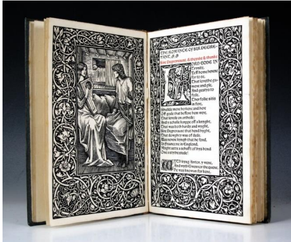
شكل (٧) وليام موريس كتاب بالقوالب الخشبية- القرن ١٩

تطلب إنتاج رسوم الكتب المبكرة في القرن الخامس عشر وسائط مختلفة عن وسائط الرسم والتلوين اليدوية المستخدمة في رسوم المخطوطات. ونشأ إنتاج الكتب مع وسيط الطباعة الفنية بالقوالب الخشبية في الصين، وتم حفر النصوص والرسوم المصاحبة لها على قالب خشبي واحد، ولذلك عُرفت بكتب القوالب، وأقدم كتاب صيني مطبوع بالقوالب هو الحكمة الماسية عام ٨٦٨ م.