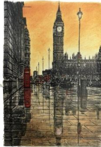
شكل (٨) ساعة بيج بن في ليلة ممطرة - ستيفن ولتشير- ٢٠٠٨ - أقلام و حبر و طباشير زيتي