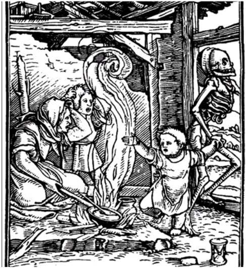
شكل (٣) يد الموت تخطف الصغار قبل الكبار