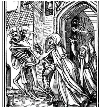
شكل (١١) يد الموت تسحب راهبة إلى الدار الآخرة