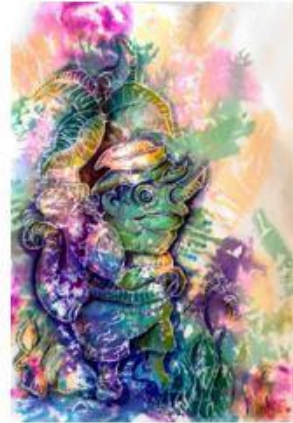
كائنات خيالية - نوران حافظ - وسائط مختلطة