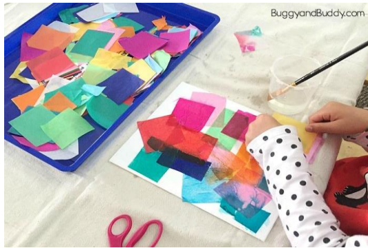
شكل (١٧) تطبيق الورق الملون الرطب على لوحة الرسم

عادة ما يكون التدريب البسيط، بداية طيبة للطلبة في أي فصل دراسي جديد، فهم لا يريدون بداية ثقيلة بتدريب شاق ومجهد للذهن والجسم. وكلما كان وسيط التنفيذ سهلاً، كان العمل به ممتعاً ومسلياً، ويشعر الطلاب بالمرح والسعادة، ويقبلون على الدراسة بصدر رحب، وكلهم نشاط وحيوية.