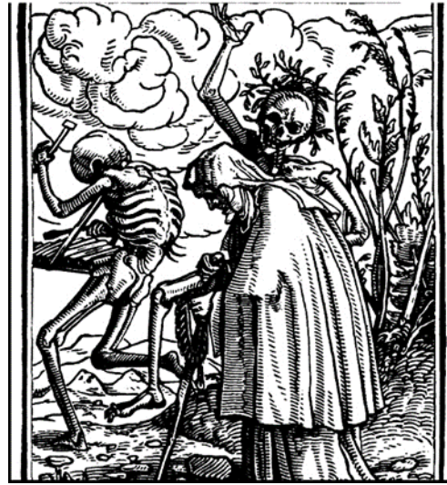
شكل (٢) يد الموت ترقص بحماس و تسحب الناس

٢- الرسوم الإيضاحية في نشر العلم والمعرفة وتنمية وتطوير القدرات البشرية والحياة الإجتماعية منذ أن كانت الكتب مخطوطات تكتب بخط اليد، احتوت علي رسوم إيضاحية تصور شتي العلوم والمعارف، رسوم لمعارك تاريخية، وأخري لخرائط فلكية وجغرافية، وأيضاً رسوم تشريحية للإنسان والنبات والحيوان، وكذلك رسوم لكيفية تحسين مهارات فنون القتال والمبارزة والفروسية وصيد الحيوانات، وغيرها. وفي العصور الحديثة ومع بداية القرن الثامن عشر، بدأ الفن يتخذ دوراً مهماً في تنمية وتطوير العلوم والآداب والتاريخ، وكيفية عرض وتوضيح المعلومات والإكتشافات العلمية والأفكار الأدبية والمواقف والأحداث التاريخية. بالطبع لا يمكن أن ننسي هذا الكم الهائل من الرسوم الإيضاحية العلمية علي مدار حياتنا الدراسية، بدءاً من رسوم الجزينات والفيروسات وحتى الرسوم العلمية للكون، وكذلك من التشريح الداخلي للإنسان والنباتات والحيوانات، وحتى تلك الرسوم التي تعيد تصور أشكال الحياة المنقرضة. هذه الرسوم ساعدتنا كثيراً في فهم أصعب النصوص العلمية، بل وثباتها في ذاكرتنا.