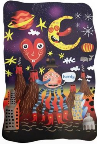
شكل (٩) مرحبا - الكسندر بلو- ٢٠٠٦ الستراتور و فوتوشوب

علي الإبداع والمهارة التي لا تزال قائمة وإليكم بعض من هذه الرسوم المجمع، شكل (٨،٩،١٠)