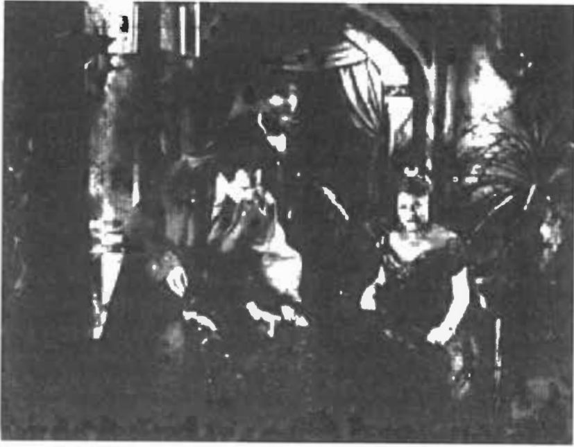
أثناء تصوير انفسر ذو الراسين - جان كوكتو (إلى اليسار) وايفون دو بريه (إلى اليمين)