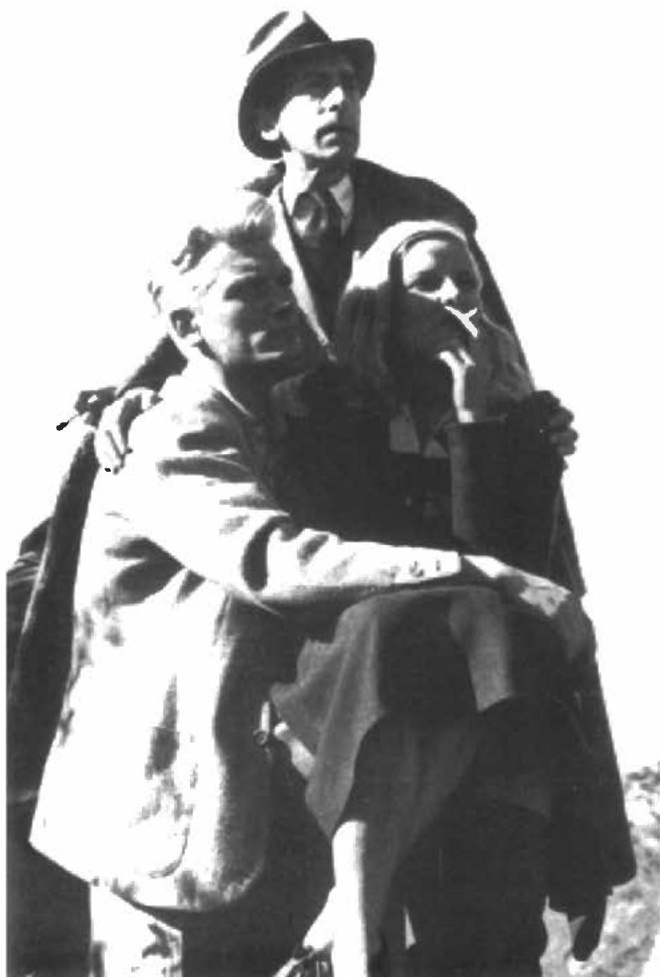
تصوير فيلم 'العودة الأبدية' - جان ماريه، جان كوكنو ومادئين سولون