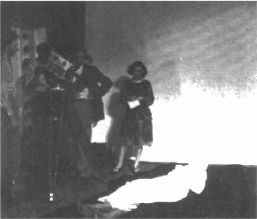
من تصوير فيلم دم الشعاع