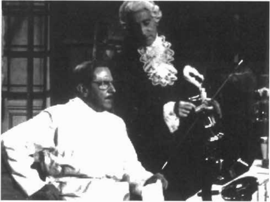
وصية أورفيه - هنري كريميو (اليسار) وجان كوكتو (اليمن)