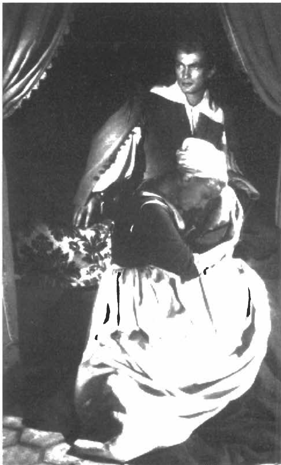
الحسناء والوحيثن - جوزيت داي وجان ماريه