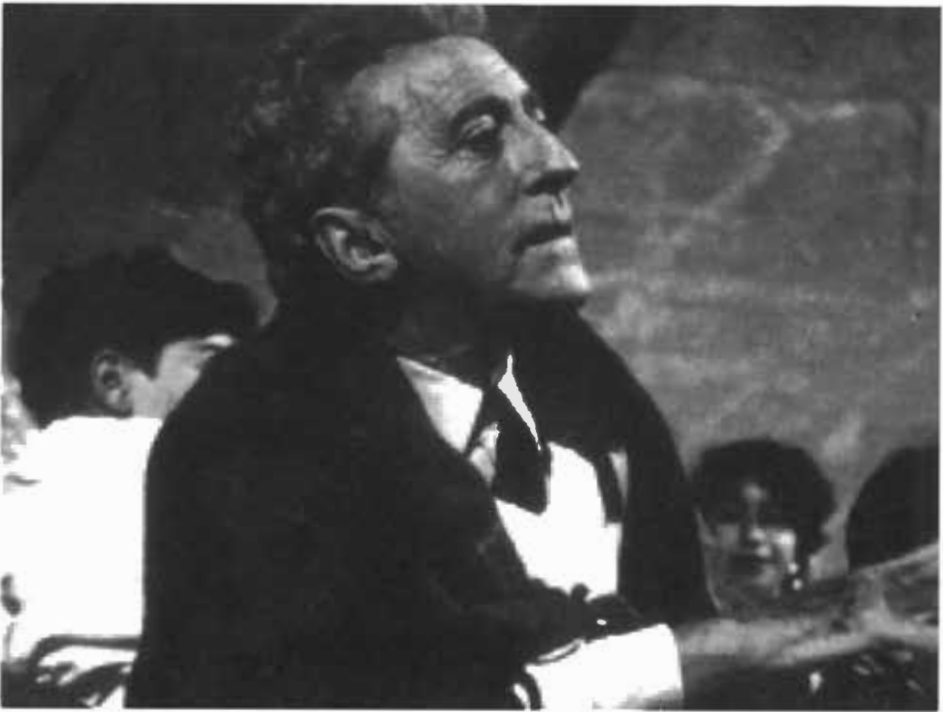
جان كوكتو في موقع تصوير فيلم 'وصية أورفيه'