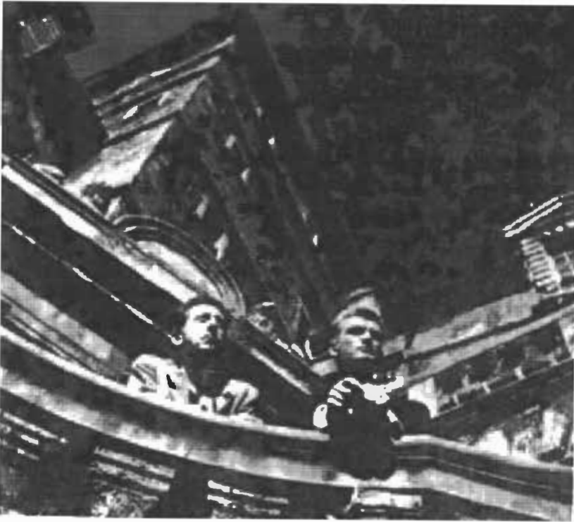
انفسر ذو الراسين - جان كوكتو وجان ماريه