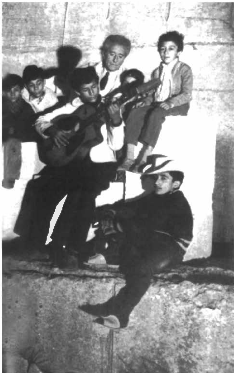
وصية أورفيه - جان كوكتو