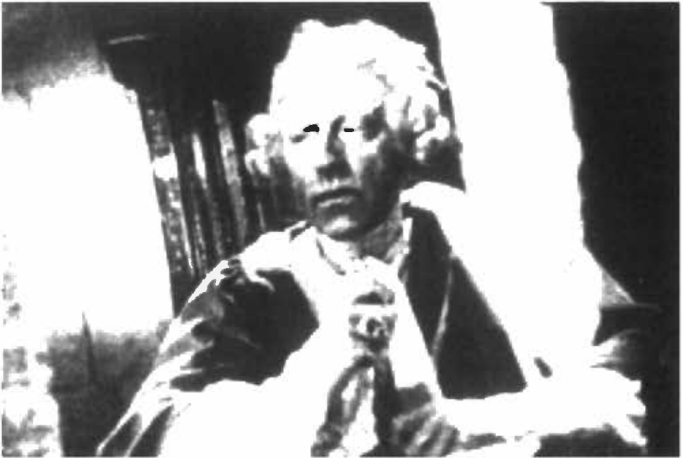
البارون الشبح - جان كوكتو