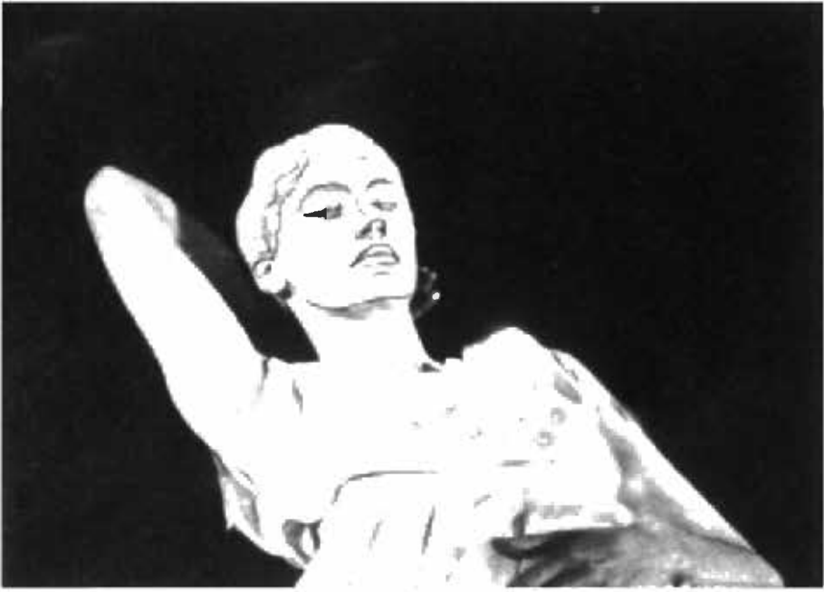
من فيلم دم الشعاع - لي ميلر