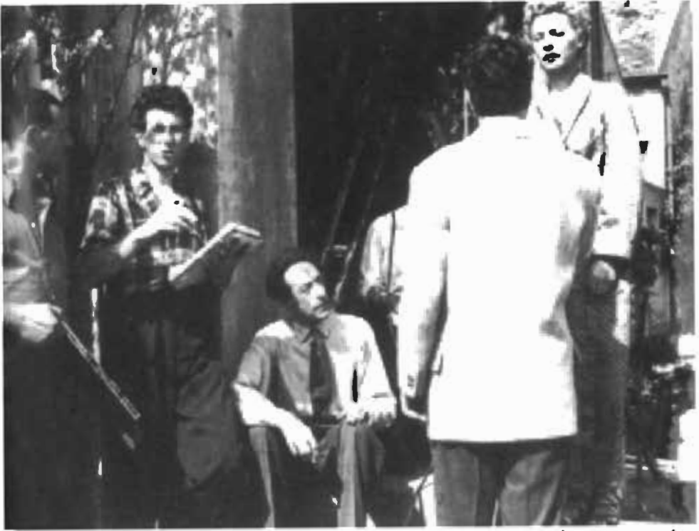
أثناء تصوير أورفييه - جان كوكتو (في الوسط) وماري داي (واقفة، إلى اليمين)