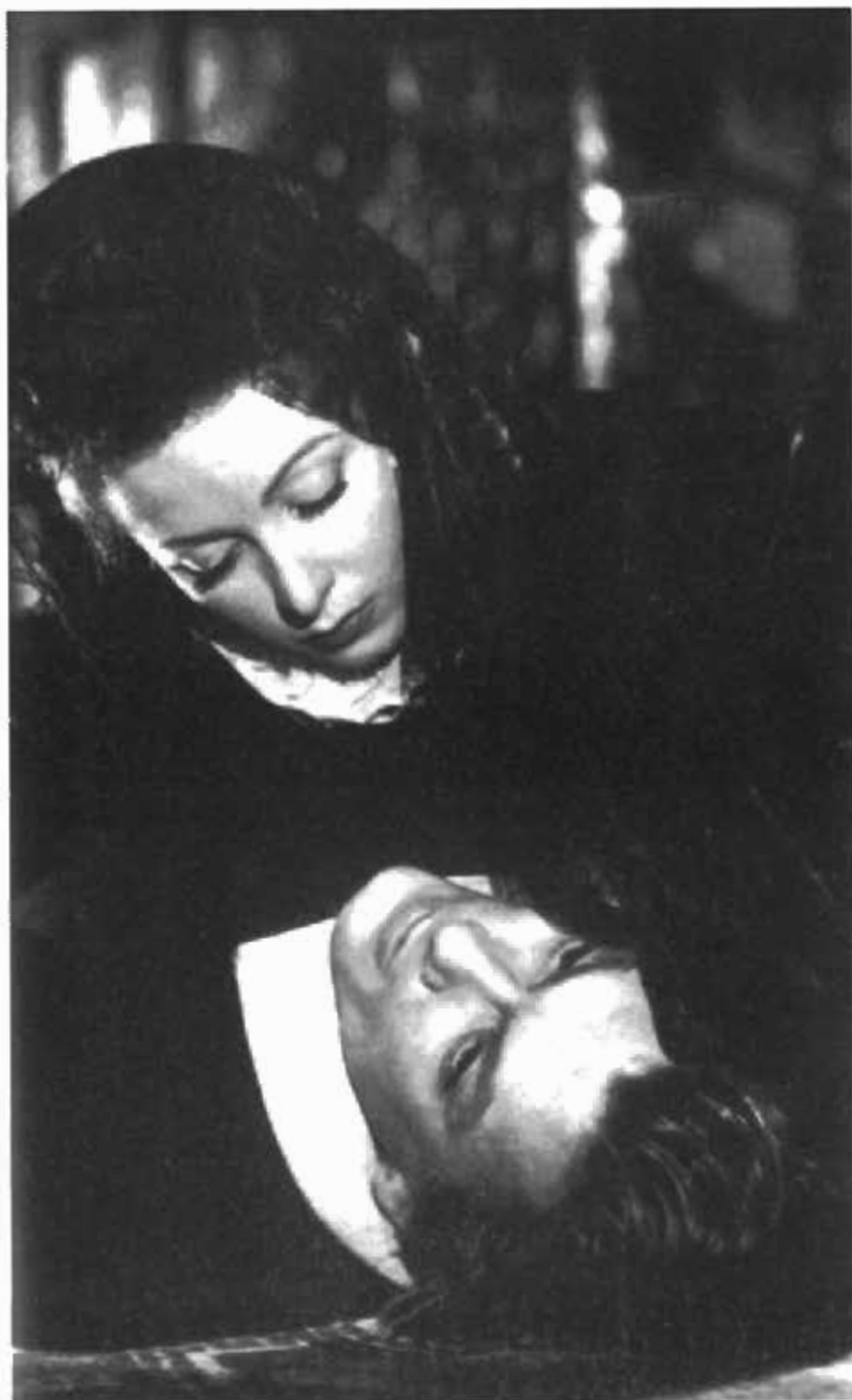
فیلم روی بلاس - دانویل داریو و جان ماریه