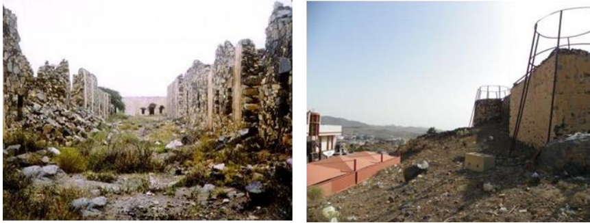
شكل رقم (11) قلعة شمسان