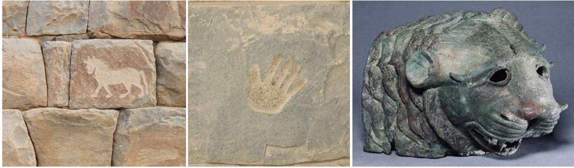
شكل رقم (6) يوضح النقش على الصخور (من آثار الأخدود)