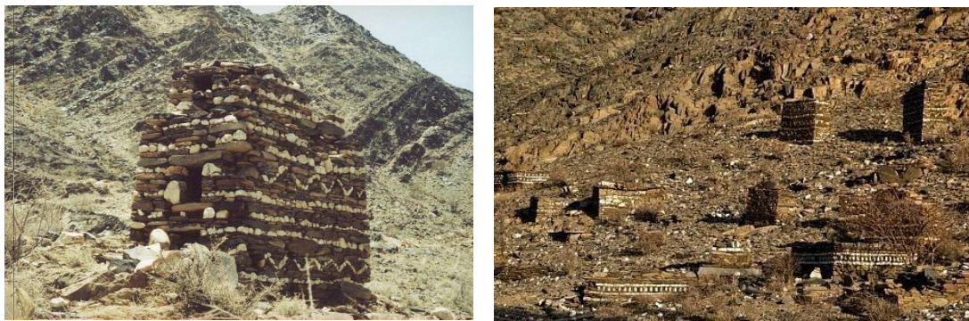
شكل رقم (12) وادي عياء

أما المساجد فقد بنيت بالحجارة أيضا وهي مشابهة في تصميمها المعماري، فهي مربعة الشكل مقسمة إلى فناء مكشوف ومصلى مسقوف تبلغ مساحة الفناء تقريبا مساحة المصلى الذي يحتوي على محراب نصف دائري بسيط، وتختلف مساحة هذه المساجد حسب سعة البلدة التي يقع المسجد فيها. كما تنتشر المقابر بكثرة في مواقع وادي عياء قسم منها يعود لفترة ما قبل الإسلام وقسم آخر يعود للفترة الإسلامية المبكرة وتتميز بمقابل فترة ما قبل الإسلام بأنها عبارة عن غرف صغيرة أقيمت فوق سطح الأرض على هيئة متوازي المستطيلات مبنية بالحجارة يتراوح ارتفاعها عن سطح الأرض ما بين نصف متر إلى أكثر من مترين وفي جانبها الشرقي توجد فتحات أو أبواب صغيرة ربما استخدمت لإدخال جثث الموتى، حيث كان القبر الواحد يخصص لأكثر من شخص شكل رقم (12).