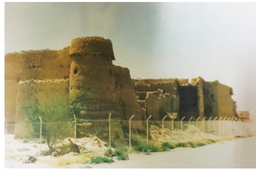
شكل (4-أ) يوضح برج آل جميعة من الخارج