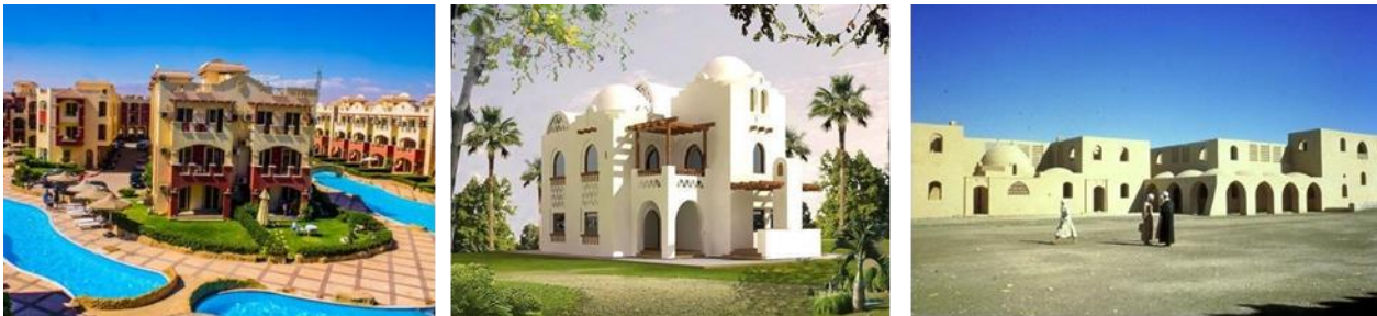
شكل رقم (14) تصميمات من العمارة البيئية المعاصرة في مصر