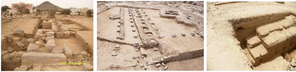
شكل رقم (13) بلدة جرش