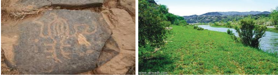
شكل رقم (9) منطقة تثليث والكتابات الصخرية المحفورة

وهو من أهم المناطق الأثرية لما تحتويه من عشرات المواقع المختلفة منها ما يعود إلى العصر الحجري القديم والعصر الحجري الحديث ومواقع من حضارة جنوب الجزيرة العربية، كما تنتشر فيها مواقع الرسوم والنقوش الصخرية والكتابات شكل رقم (9).