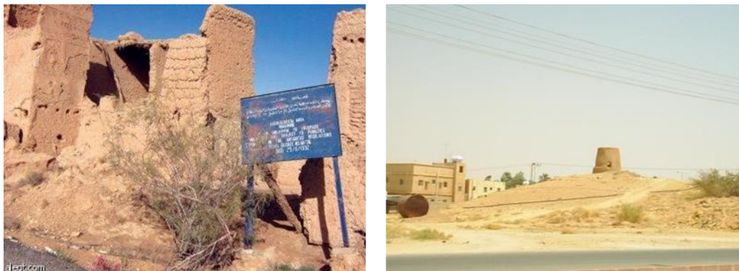
شكل (2) يوضح قصر الملك سليمان

وكان لموقع سدوس المتوسط في نجد وتربعه على أحد الطرق المهمة في الجزيرة العربية تأثير ملموس في تطوره ونموه العمراني. حيث أنشئت فيها القلعة "حي البلاد" وشيد لها سور محكم وأبراج جيدة ولا يزال موقعه وقربه من العاصمة يعطيانه بعض التميز والدافع للنمو العمراني حتى وصلت إلى ما هي عليه الآن، وجدير بالذكر أن أول من حدد عدد منازل سدوس لويمر الذي ذكر أنها مكونة من 160 منزلاً بعد العمران الأول تلاه عمران مجتمعات أخرى في عهد الملك عبد العزيز بدأ بتوسع في القلعة خارج الصور بإضافة بعض الغرف ثم أنشئ حي جدة، وحي مصدة، وحي المنارة وكلها مباني التقليدية بالحجر أو بالطين ثم أدخلت عليها طبقة من الأسمنت كقشرة محارة، ومن أهم معالم سدوس قصر يقال: إنه بناه النبي سليمان عليه السلام وقع بالقرب من حصن سدوس شكل رقم (2) القصر القديم . وهو عبارة عن رابية مكونة من ركام وأنقاض تدل على أنه نتيجة لمبان عظيمة في زمن مضى، وينتصب على تلك الأنقاض عمود رائع من الحجر المنحوت، ولقد كان رأسه مكسورة ولكن اسطوانة العمود نفسه ما زالت ترتفع إلى حوالي عشرين قدماً، وكانت الكتل الحجرية مستديرة، حيث كانت كل كتلة متناسقة في الحجم مع حجم العمود الذي ربما كان يبلغ قطره حوالي ثلاثة أقدام. وكانت القاعدة والقوصرة - دائرية - مقطوعة أيضاً من الحجر وبحجم مناسب لارتفاع العمود وقطره. لقد كان سكان القرية يستخرجون الحجارة والتربة من الأطلال المجاورة.