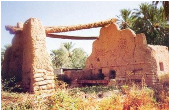
شكل (4-ب) يوضح العمارة في سدوس في بناء الأبار