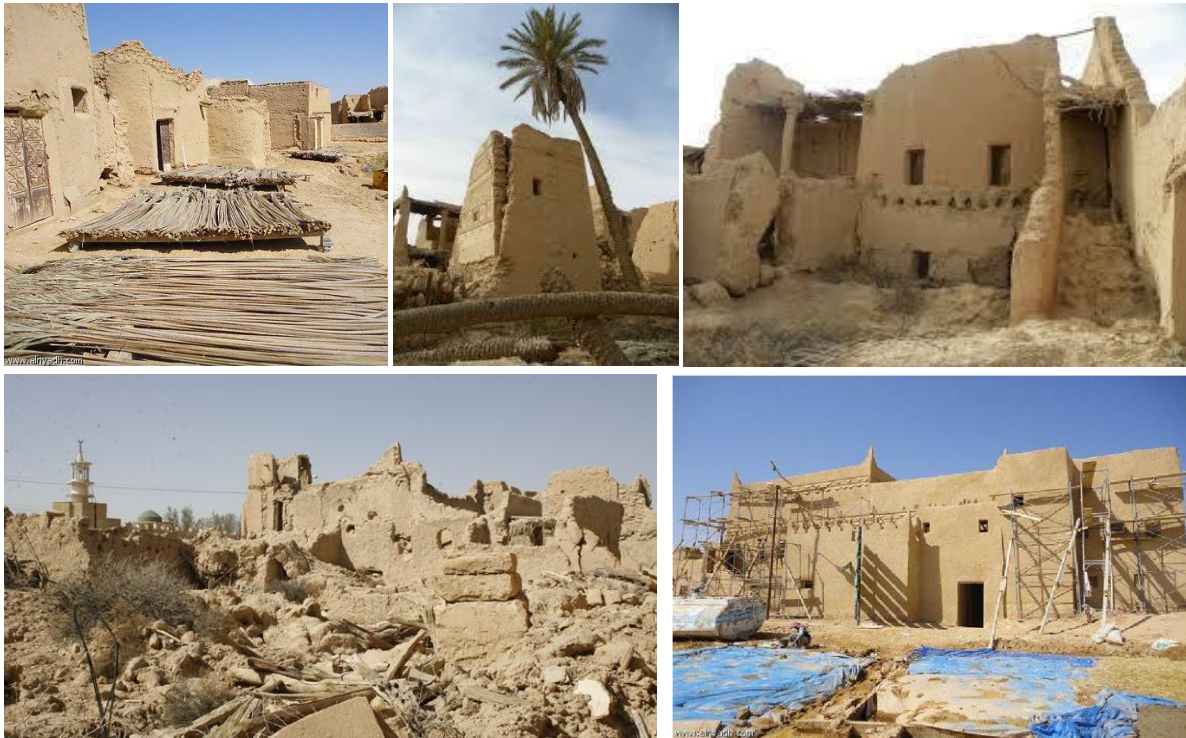
شكل رقم (3) يوضح النماذج المعماري في سدوس

وعند التحليل المعماري للمنشآت المعمارية السكنية نجد أنها قد تأثرت بالأعراف والتقاليد كمحور مهم للتكوينات، كما كان للمحور الديني أثره الواضح في هذا التشكيل سيما وأن التمسك بالقيم والمبادئ أصبح سمة من سمات المجتمع في المنطقة، وتمازج العرف والتقاليد أصبح واضحا مع التمسك بتطبيق التعاليم والمبادئ الإسلامية تطبيقاً واقعياً صار مع الالتزام بمثابة السلوك والعادة مما انعكس مباشرة في النسيج المعماري لعمارة البلدة وتمثل الحلول المعمارية التي تحقق الخصوصية أروع مثال لذلك التمازج شكل رقم (3)