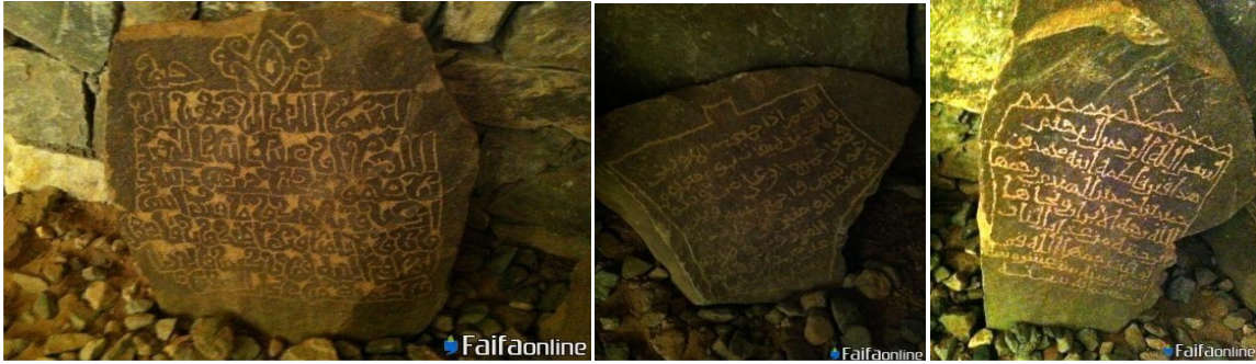
شكل رقم (7) يوضح بعض الكتابات العربية الأثرية على الصخور