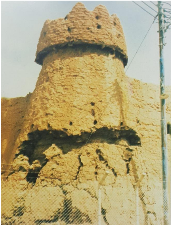
شكل (4-أ) يوضح واجهة برج السلطان

ولأهالي البلدة خبرة في إنشاء التحصينات الدفاعية، تلك الخبرة التي انعكست في تخطيط الدروازة وبناء الأسوار والأبراج، والأبار وتخطيط الشارع الرئيسي وما يتفرع منه من طرق جانبية وهي الخبرة التي عكست مستوى متقدم من مستويات التخطيط، والإنشاء الحربي ليس بمعزل عن مثيله في المستوطنات والمدن الإسلامية الكبرى، بل إن أسلوب التخطيط والإنشاء أحيانا عكس حولا محلية تأثرت إلى حد كبير بأساليب الهجوم والدفاع في منطقة نجد. ومن المهم أن من الأساليب أيضا ما توارثتها الأجيال عبر العصور في تقليدية مستمرة تؤكد أصالتها في الجزيرة العربية بصفة عامة، ولعل أوضح مثل على ذلك هو أسلوب بناء الأبراج التي يقل قطرها كلما ارتفع وهو أسلوب عربي شهير كان فيه ما يحقق متانة الإنشاء والتخلص مما يسمى بالزاوية الميتة، وتتنوع البلدة هذه النوعية من المنشآت استيعاباً يوافق متطلبات وحاجات المجتمع المادية وبناء الأبار التي تحافظ على مياه الأمطار والمياه الجوفية التي تميزت بها مديرة سدوس شكل رقم (4) (أ-ب) يوضح الأبراج في مدينة سدوس