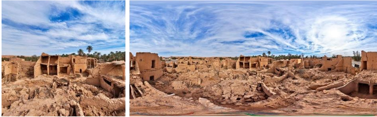
شكل رقم (1) يوضح المدينة القديمة في سدوس

للزراعة والموقع والأمن وقدرة الإنسان على استثمار هذه العوامل وتظل المياه من أهم العوامل التي أسهمت في تطوير العمران حيث تسهم السيول في رافع مخزون المياه الجوفية كما أسهمت في نشأة وتطور البلد إذ لتربته الرسوبية الصالحة للزراعة دور فاعل في قيام وازدهار الزراعة فيها واختيار مناطق السكني والتوسع العمراني الذي تلا ذلك شكل رقم (1) المدينة القديمة.