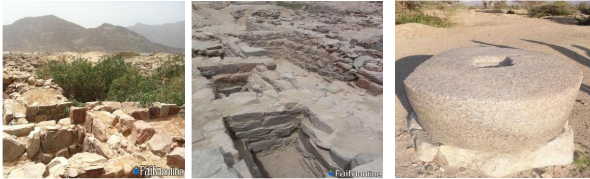
شكل يوضح بعض المدافن