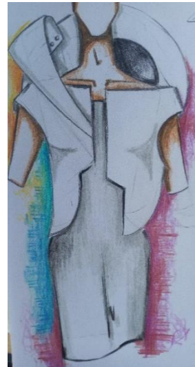
تصميم (١٠) صورة نحت (٣) - تصميم (١١) صورة نحت (٤) : تصميم لفستان مبطن بدعامة - تصميم (٨) دعامة من الفازلين المقوى، تصميم (٩) مدعم بحشوة من التل القاسي السميك و بطانة من خامة كالساتان، و يقترح أقمشة الساتان السميك لتنفيذ التصميمين. و الأعمال النحتية للفنانة .Cameron Otero