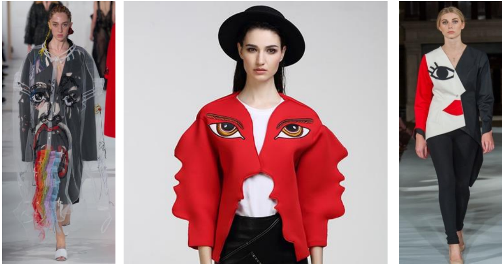
صور (١٧-١٨-١٩): اليمين التصميم يحاكي الوجه بأسلوب سورريالي من خلال استخدام خامتين العلوية شفافة و يتم رسم تعبيرات على الوجه مختلفة من أعلى و من أسفل لتتباين الرؤية. الوسط نسج التريكو ثلاثي الأبعاد 3D Weave 2017. على اليسار بورتريه جانبي بأسلوب الفن التكعيبي.