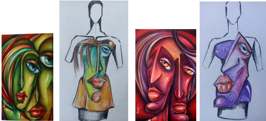
تصميم (٣) لوحة (٣) + تصميم (٤) لوحة (٤) : تصميم لتونيك انتاج فردي - تلوين القماش بصبغات القماش - اضافة الملامح رسم و أجزاء تركيبية. اللوحة من مجموعة بورتريه للمصور Michael Lang. التصميم رقم (٣) يحتاج دعامة داخلية من الفازلين اليابس المقوى، التصميم (٤) يتم اضافة خيوط حريرية ناعمة لتحاكي خصلات الشعر على منطقة الصدر.