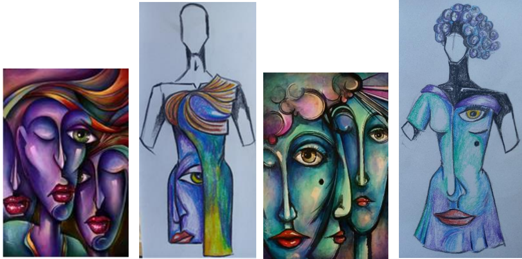
تصميم (١) لوحة (١) - تصميم (٢) لوحة (٢) :تصميم لفستان انتاج فردي - تلوين القماش بصبغات القماش - اضافة الملامح رسم و أجزاء تركيبية. اللوحة من مجموعة بورتريه للمصور Michael Lang