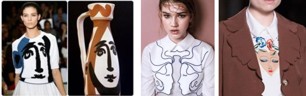
صور (١-٢-٣): اليمين تصميم Ricani di Stagione- الوسط تصميم بقصة بارزة لوجهين من قصص الجنيات - اليسار التصميم ل Benjamin Shine و الفنان الخزاف Maison Margiela