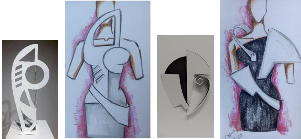
تصميم (١٢) صورة نحت (٥) - تصميم (١٣) صورة نحت (٦) : تصميم لفستان مبطن بدعامات - في كلا التصميمين يستخدم التل القاسي السميكة كحشو داخلي و بطانة من خامة كالساتان، و يقترح أقمشة الساتان السميكة لتنفيذ التصميمين. و الأعمال النحتية للفنانة Cameron Otero .