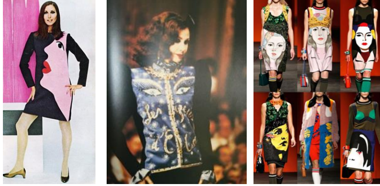
صور (١٠-١١-١٢): اليمين Milan fashion week SS 2014. الوسط بيت أزياء اف سان لوران جاكيت بعنوان "عيون اليسا" و المقصود اليسا شاباريللي التصميم ١٩٨٠. اليسار تصميم آخر لبيت أزياء اف سان لوران في مقال بمجلة Vogue عام ١٩٧١ و تكرر التصميم ٢٠١٤ بأسلوب معاصر.