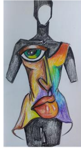
تصميم (٦) لوحة (٦) - تصميم (٧) لوحة (٧): تصميم لتونيك انتاج فردي - تلوين القماش بصيغات القماش - اضافة الملامح رسم و أجزاء تركيبية. يمكن تبطين الأجزاء التركيبية بطبقة من الاسفنج كحشوة داخلية لاعطائها ارتفاعا و بروزا عن التونيك. اللوحة من مجموعة بورتريه للمصور Michael Lang