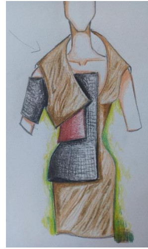
تصميم (٨) صورة نحت (١) - تصميم (٩) صورة نحت (٢): تصميم لجاكيت مبطن بدعامة - تصميم (٨) دعامة من الفازلين المقوى، تصميم (٩) مبطن بالتل القاسي السميك و بطانة من خامة كالساتان، و يقترح أقمشة الساتان السميك لتنفيذ التصميمين. و الأعمال النحتية للفنانة .Cameron Otero