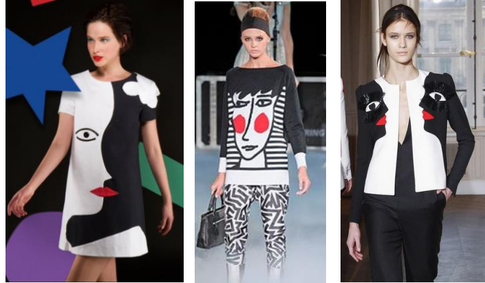
صور (٤-٥-٦): اليمين: Schaiparelli A/W 2017 - الوسط الوجه بأسلوب تجريدي تعبيرى المصمم Jean-Charles de Castel Bujac SS 2012 - اليسار الوجه بأسلوب سورريالي.