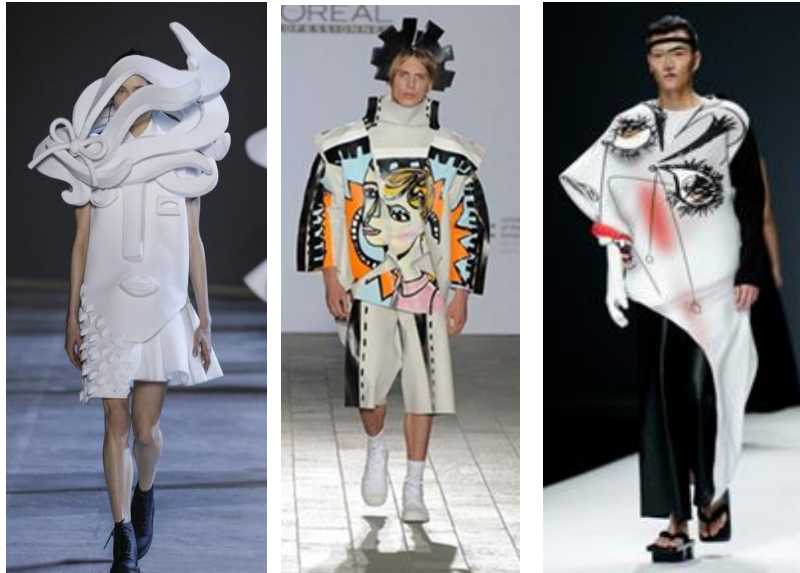
صور (٧-٨-٩): أقصى اليمين تصميم Lenie Boya SS London fashion week 2015- الوسط براند باسم Doctor Viktor & Rolf SS2016 - أقصى اليسار Raf Simons