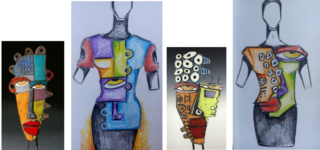
تصميم (١٤) صورة خزف (١) - تصميم (١٥) صورة خزف (٢): تصميم لجاكيت قصير- يقترح أن يكون التنفيذ من قماش الكتان السميكة اذا كان لموسم الصيف و من خامة اللباد الصوفي الناعم اذا كان لفصل الشتاء، يتم تركيب المعالجة الفنية لشكل الملامح كأجزاء خارجية و يمكن اضافة حشوة من الفازلين اسفلها، و بعض الأجزاء اضافة الاسفنج كحشوة للحصول على تدرج في البروز. و العمل الخزفي للفنان Kimmy Cantrell .