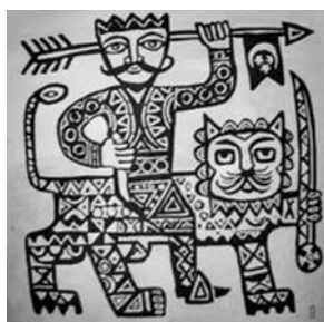
شكل ( 3 )

فالاسد من الرموز الحيوانية الشعبية التي ترمز الي القوة، و الشجاعة، و السيادة ، و التحكم،و الادراة منذ اقدم العصور ، و قد أكدت الموروثات الشعبية ان للأسد مدلول روحي ، و الاستعانة به يحقق أغراض يعجز الانسان عن تحقيقها بالوسائل المنطقية كما في الشكل 3 يتضح شكل مبسط لخطوط الأسد (3- ص 168).