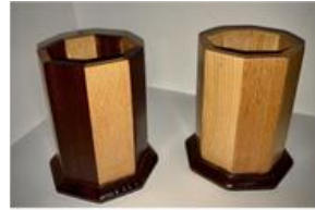
صورة رقم (5)