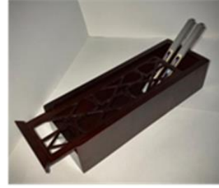
صورة رقم (3)