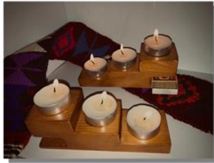
صورة رقم ( 10 )