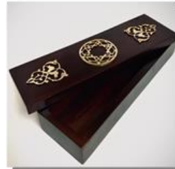
صورة رقم (7)