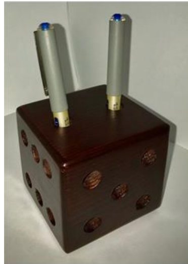
صورة رقم ( 6 )