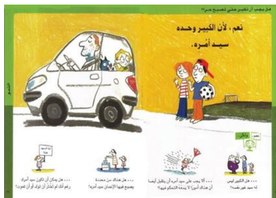
الشكل رقم ( 8 ) يوضح الإجابة على السؤال السابق " نعم ، لأن الكبير وحده سيد أمره" 19