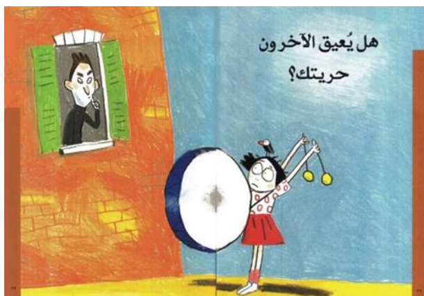
شكل رقم ( 5 ) تصميم صفحتين داخليتين ، هل يُعيق الآخرون حريتك؟ 16