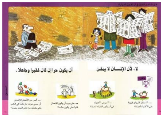
شكل رقم (12) يوضح الإجابة "لا، لأن الإنسان لا يمكن أن يكون حراً إن كان فقيراً وجاهلاً" 23