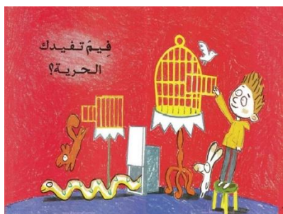
شكل رقم ( 13 ) يوضح سؤال – فيَم تفيدك الحرية؟ 24