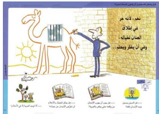
شكل رقم ( 10 ) يوضح الإجابة " نعم ، لأنه حر في إطلاق العنان لخياله ، وفي أن يفكر ويحلم...." 21