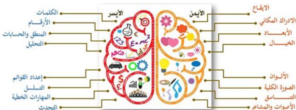
الشكل رقم ( 1 ) رسم تخطيطي يوضح اقسام المخ والعمليات التي يمكن ان يقوم بها كل قسم ومنها الخيال12