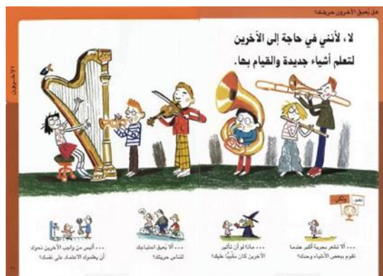
الشكل رقم ( 6 ) إجابة السؤال السابق من خلال صفحتين متصلتين " لا ، لأنني في حاجة إلى الآخرين لتعلم أشياء جديدة و القيام بها" 17