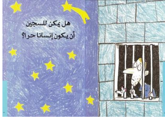
شكل رقم ( 9 ) يوضح سؤال - هل يمكن للسجين أن يكون إنساناً حراً؟ 20