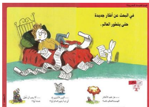
شكل رقم ( 14 ) يوضح الإجابة – في البحث عن أفكار جديدة حتى يتطور العالم. 25