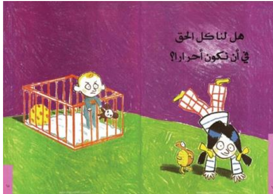
شكل رقم ( 11 ) يوضح سؤال - هل لنا كل الحق في أن نكون أحراراً؟ 22