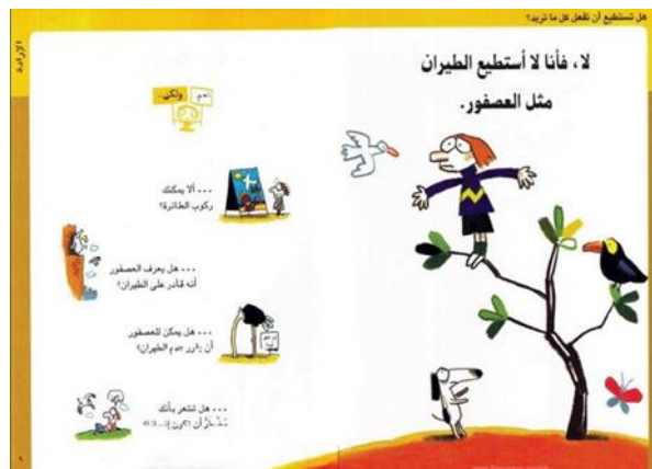
شكل رقم ( 4 ) صفتين داخليتين من نفس الكتاب والذي يوضح من خلالهم الإجابة على التسائل السابق.15