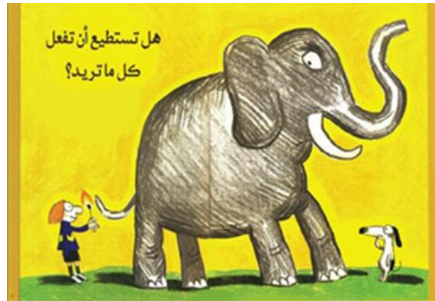
شكل رقم ( 3 ) تصميم لصفتين متصلتين في الكتاب ومكتوب اعلى اليسار " هل تستطيع أن تفعل كل ما تريد؟"14