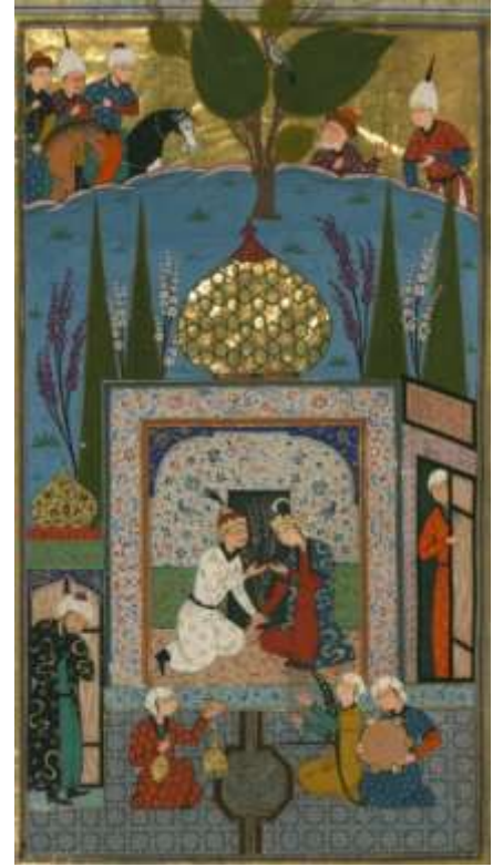
لوحة رقم(7) بهرام گور يجلس في الجناح الأبيض رقم الحفظ MS. W.607