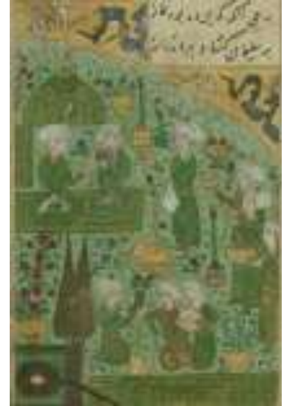
لوحة رقم (1) بهرام گور يجلس في الجناح الأخضر رقم الحفظ MS. W.605