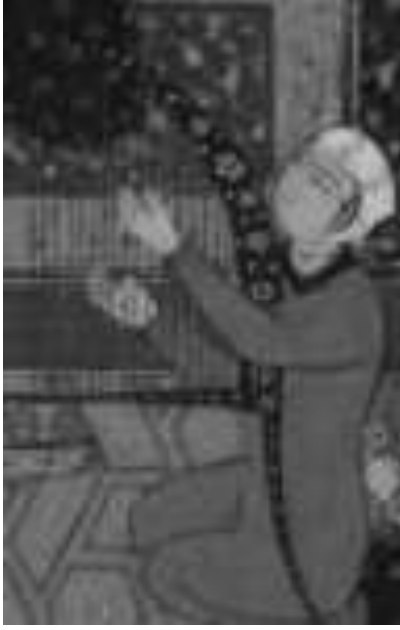
شكل رقم (2) آلة الجنك