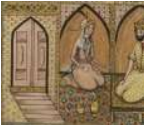
لوحة رقم(10) بهرام گور يجلس في الجناح الخشبي رقم الحفظ MS. W.608