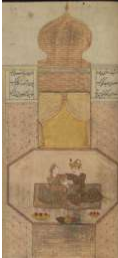
لوحة رقم (2) بهرام گور يجلس في الجناح الخشبي رقم الحفظ MS. W.606