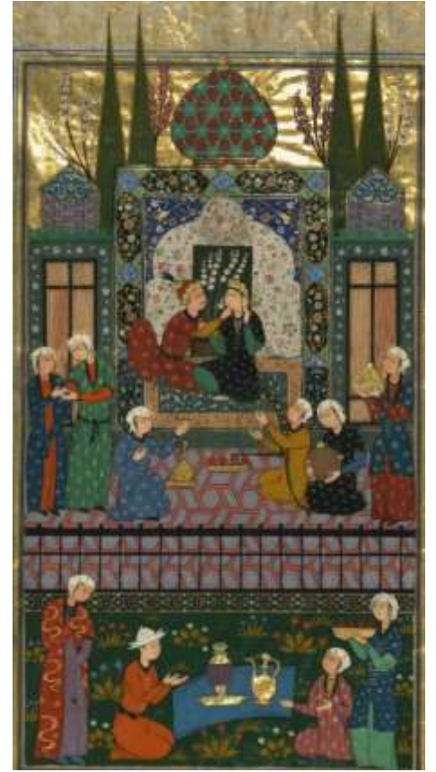
لوحة رقم(3) بهرام گور يجلس في الجناح الأسود رقم الحفظ MS. W.607