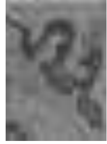
شكل رقم (1) السحب الصينية