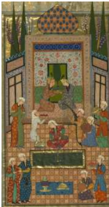
لوحة رقم(6) بهرام گور يجلس في الجناح الخشبي رقم الحفظ MS. W.607