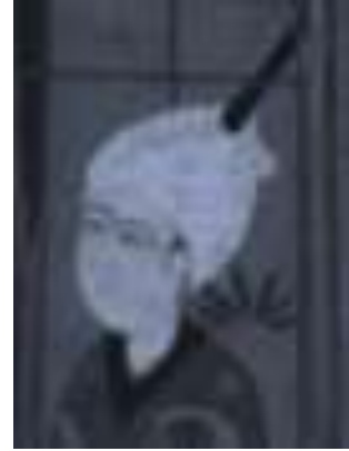
شكل رقم (3) العصا التي تخرج من العمامة