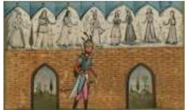
لوحة رقم(9) بهرام گور وصور الأميرات السبع رقم الحفظ MS. W.608