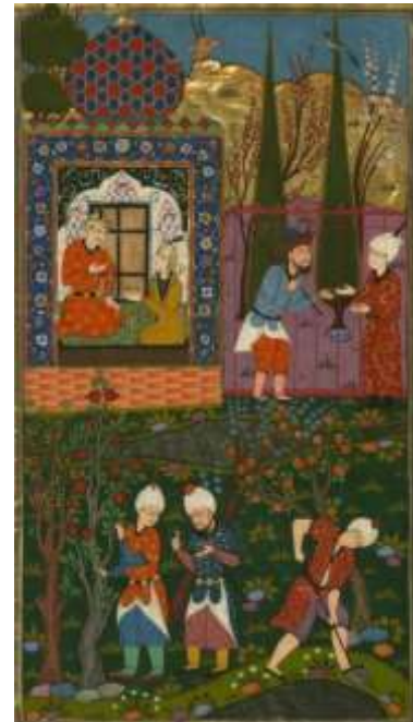
لوحة رقم(5) بهرام گور يجلس في الجناح الأزرق رقم الحفظ MS. W.607