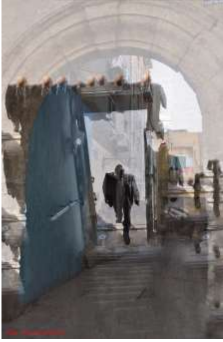
(لوح 6) من اعمال الباحثة بعنوان فنانزية التشكيل