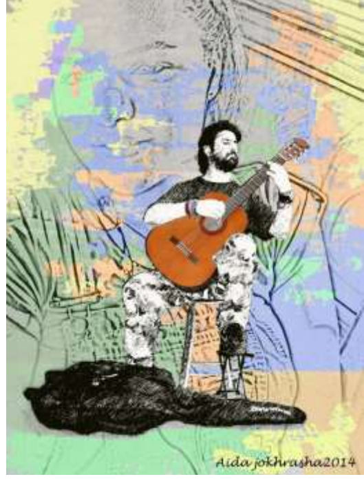
(لوح 5) من اعمال الباحثة بعنوان عزف منفرد

وكما يقول استاذ الفن التشكيلي د. فواز أبو نيان إن الفن الرقمي متطلب تشكيلي معاصر يعكس التطور التقني السريع المتنامي، وفي نفس الوقت يعكس الحالة الانفعالية للفنان بنفس سرعة هذا التنامي، فعلى الرغم من النقد الموضوعي الذي يطوله في بعض الأحيان بوصفه فن "العفوية" أو فن غير الموهوبين، إلا أنه فن له من الخصوصية بما يمكن وصفه إنه فن يحمل شخصية تعبيرية للفنان مغلقة بتقنية مغايرة تصنف حالة التقنية وليست حالة الفنان، بمعنى إنه يوظف الانطباع