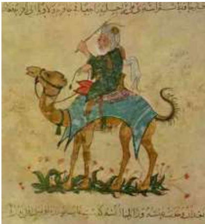
المنمنة الخاصة بالمقامة 44 (اللغزية)