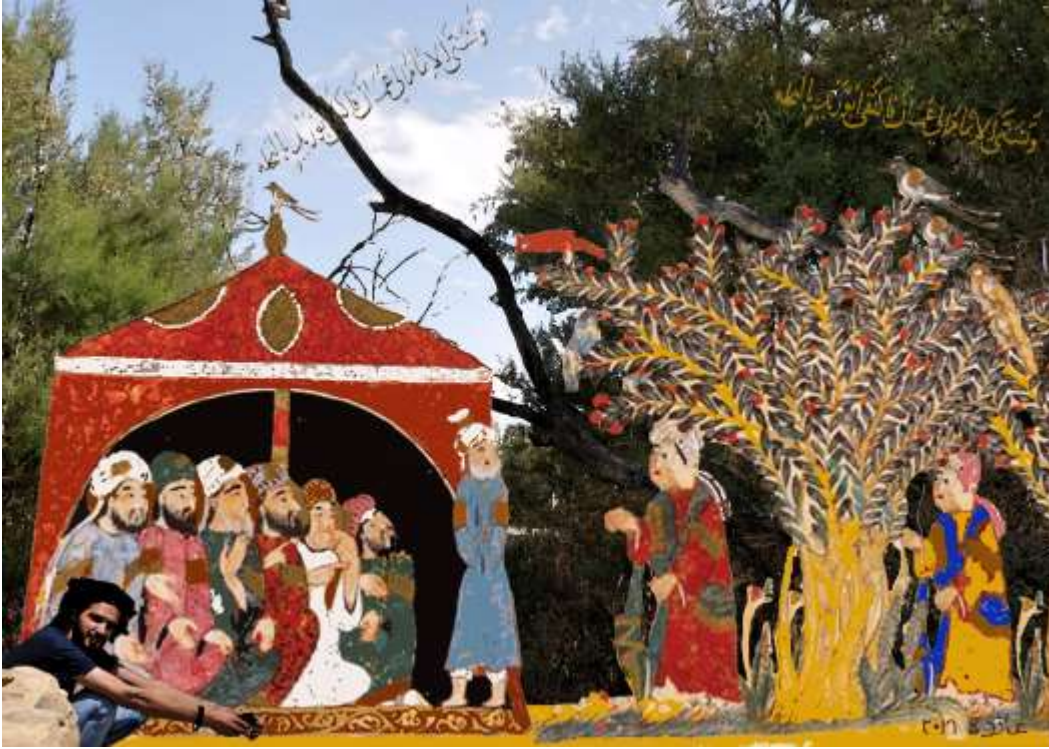
تجربة 8 (واسطيات)

في التجربة الثامنة تم دمج منمنتين من منمنمات يحيى الواسطي في عمل واحد من المقامة المكية، مع تغيير في بعض مواقع الأشخاص حسب طبيعة العمل الفني. وقد تم اختيار خلفية مناسبة من الاجواء الطبيعية لاستراحة المسافرين. مع اعطاء بعض التأثيرات عليها. وتم وضع شخص جالس في الزاوية اليسرى من العمل وذلك لدمج الحاضر بالماضي. اما اللون فقد تم تغيير بعض الاجزاء من المنمنة لابرز الاشخاص الاساسيين في اللوحة. وكذلك توزيع بعض النصوص الكتابية في الخلفية.