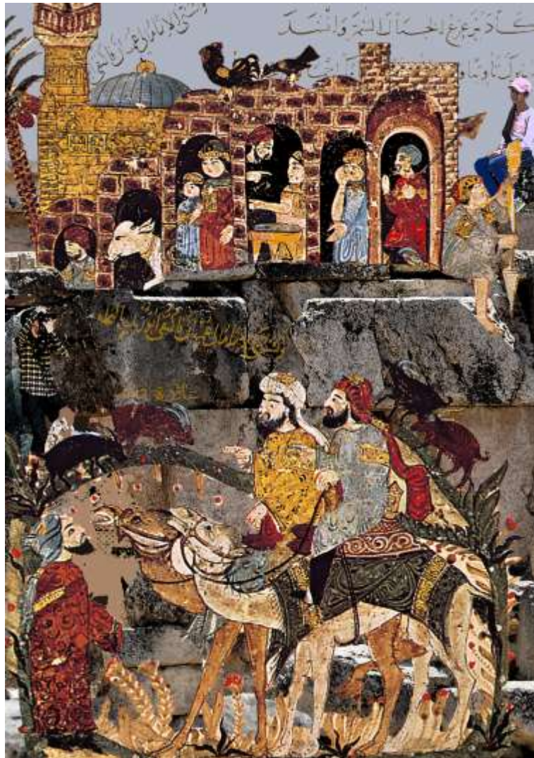
تجربة 7 (المدينة والناس)

في التجربة السابعة من المقامة البدوية تم تغيير البيئة التي اعتمدها الواسطي، وذلك بتقطيع العمل الى نصفين ورفع الجزء العلوي ليرتكز على خلفية صخرية وكان البناء نفذ بهذه الطريقة .ويقي الجزء السفلي للشخصيتين الرئيسيتين في