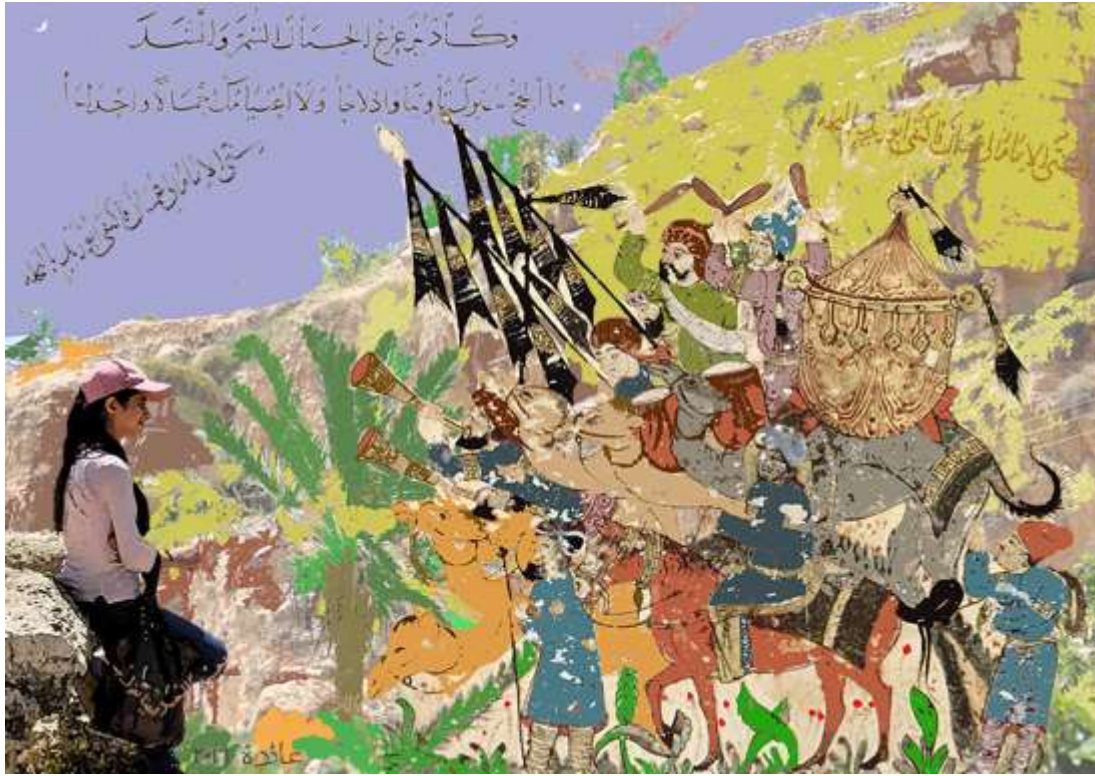
تجربة 6 (القافلة)

التجربة السابعة للباحثة بعنوان: (المدينة والناس)