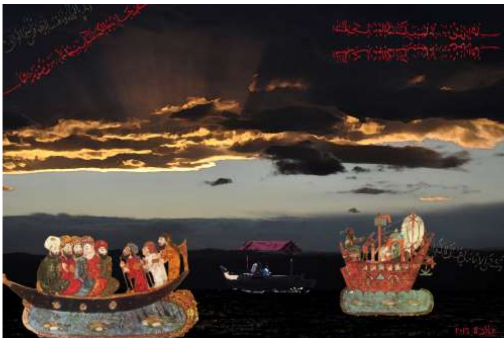
تجربة 10 (زوارق)