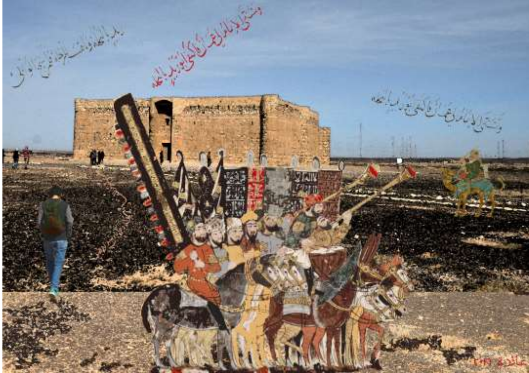
تجربة 9 (مواكب الحج)

تم اختيار المنمنة الخاصة بالمقامة البرقعيدية وهي رحلة الحج التي كان يقوم بها المسلمين باحتفالية مميزة ،وهنا تم تهيئة الاجواء الصحراوية المناسبة ،مع مكان استراحة المسافرين الواضح في خلفية العمل. وكذلك تم اضافة المنمنة 44(اللغزية)الشخص المسافر على الابل، لتصبح جزءا من اللوحة.مع اضافة شخص يسير في جهة اليسار متوجها الى دار الاستراحة.وكذلك تم توزيع النصوص الكتابية ليكتمل المشهد.مع التلاعب بالوان الارضية لتتماشى مع طبيعة الصحراء.