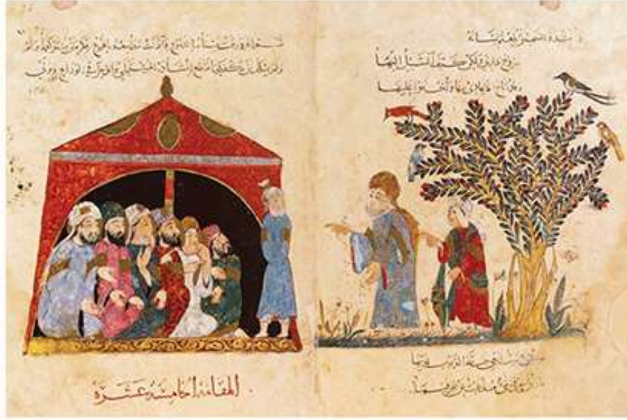
المنمنمة الخاصة بالمقامة 15 (المكية)

التجربة الثامنة للباحثة بعنوان: (واسطيات)