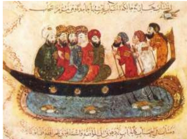
رسم للواسطي مرافق للمقامة الفراتية من مقامات الحريري عام 1237م