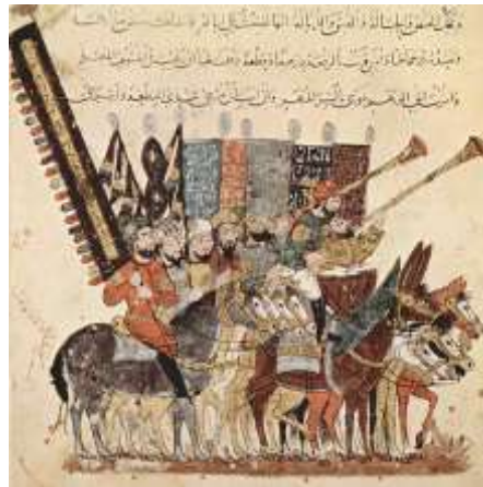
المنمنة الخاصة بالمقامة 7 (البرقعيدية)