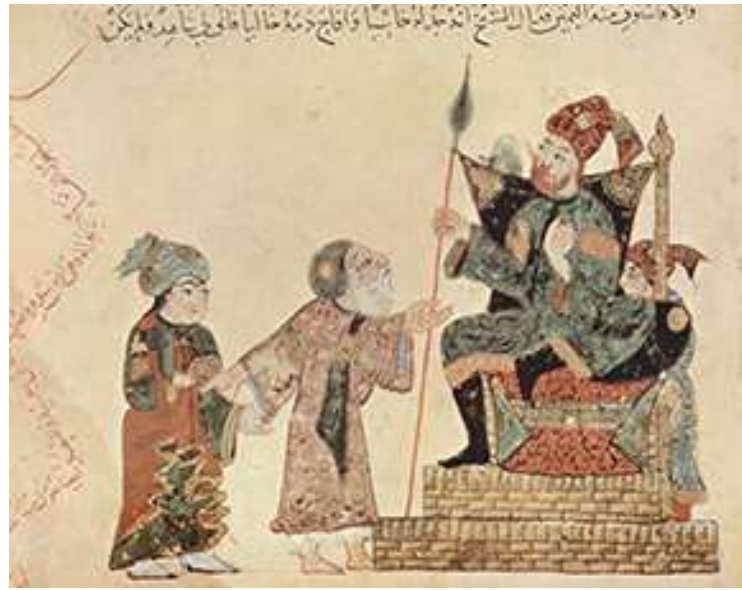
المنمنة الخاصة بالمقامة 10 (الرحبية)