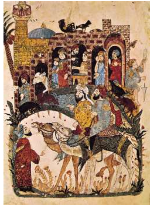
المنمنة الخاصة بالمقامة 43 (البدوية)