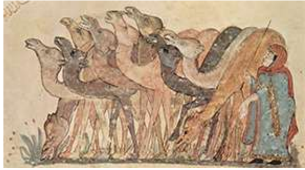
المنمنة الخاصة بالمقامة 32(الحربية او الطيبية)