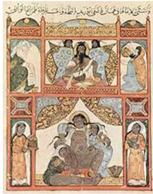
المنمنة الخاصة بالمقامة التاسعة 39(العمانية)