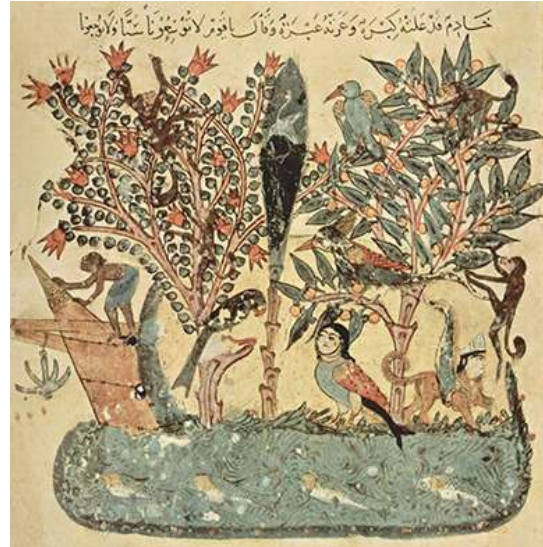
المنمنمة الخاصة بالمقامة 39 (الجزيرة الشرقية)