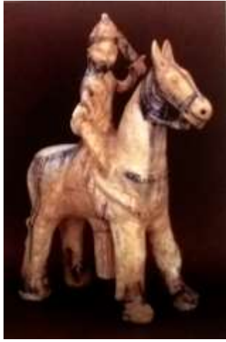
صورته (9) تمثال فارس الرقة- ايوبي - القرن 6 هـ - المتحف الوطني - دمشق 3

صورته (9) لتمثال يمثل محارباً إسلامياً (على الأرجح من جنوب شرق آسيا) يسمى فارس الرقة نسبةً للمكان الذي اكتشف فيه، له لحية ثلاثية الشكل وشفيرة تنحدر على ظهره، لابساً خوذة مخروطية الشكل، والفارس يحمل بيده اليمنى سيفاً مسلولاً، وفي يده اليسرى يحمل ميخنة مستديرة الشكل، أما الحصان الذي يمتطيه الفارس فرأسه صغير، ضخم الجسم والقوائم، وله لجام غليظ يحيط برأسه، وله سرج، ويبدو الفارس في حالة الهجوم وهذا التمثال مصنوع من الخزف، مغلف بطبقة جليز ملونه 2