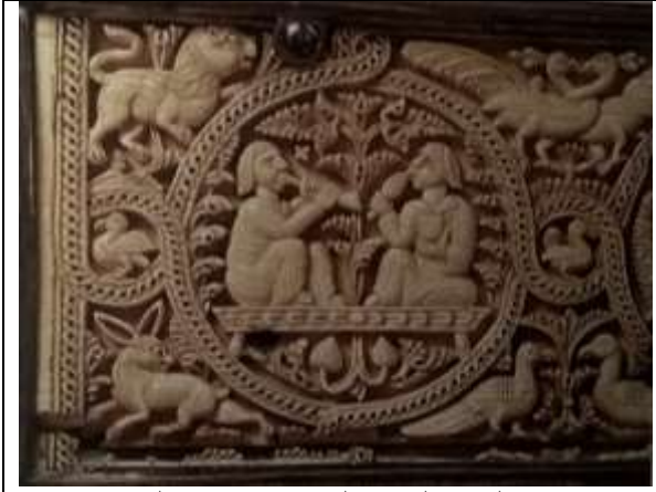
صوره (5) عليه من العاج - العصر الاموي بالاندلس - متحف فكتوريا والبرت - لندن - القرن الرابع والخامس الميلادي

يصطادونها من وعول وارانب واسود وطيور وربما نجد هذا جليا في الصورة رقم (5) وهي تمثل نحتاً بارزاً على عليه من العاج من العصر الاموي وقد صورت اثنين من العازفين جالسين على اريكه مزينه بزخارف وفي المنتصف زخرفه نباتيه مركز التشكيل ومحاطين بدائره زخرفيه وفي الحواف استخدم النحات الارنب البرى في الاسفل وفي الاعلى نحت الفنان اسدا في حاله حركه وقد جرد شعر راس الاسد بشكل بسيط ومنتظم وفي الجانب الاخر نحت مجموعه من الطيور منها المتعاقب ومنها المتقابل وجمع هنا النحات بين الزخارف الطبيعيه والهندسيه في ترابط متناغم .