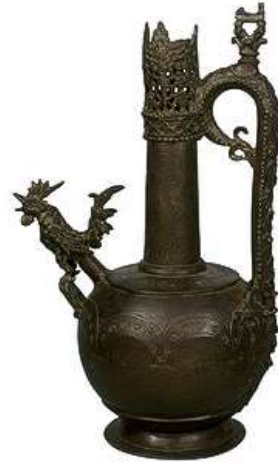
صورته (8) إبريق عبد الملك بن مروان من العصر الأموي- نحاس - القطر 28* ارتفاع 41 سم - متحف الفن الإسلامي- مصر