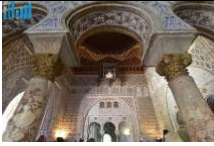
صوره رقم(3) قصر اشبيليا - يسمى قصر المورق وبنى عام567هـ ويعد من أهم اثار الاندلس ومزين بالآيات القرآنية على الجدران - مثل مسجد قرطبه (صوره 2).