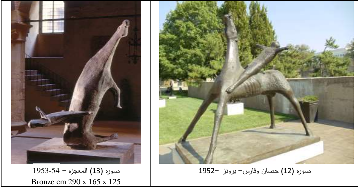
صوره (13) المعجزة - 1953-54 Bronze cm 290 x 165 x 125