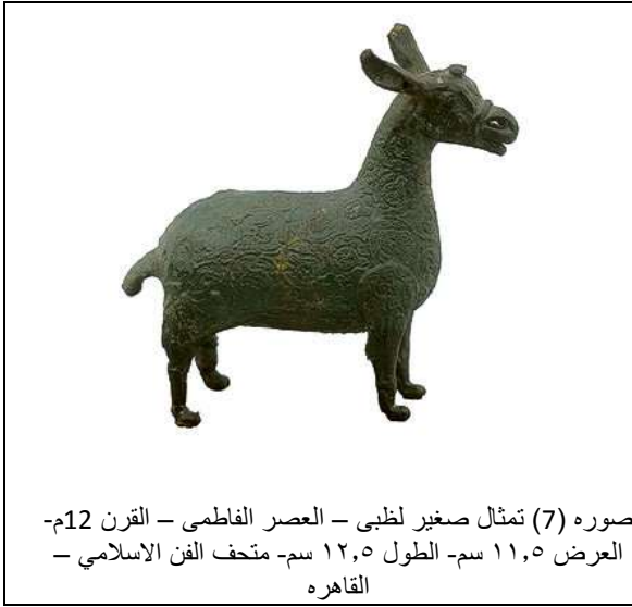
صوره (7) تمثال صغير لظبي - العصر الفاطمي - القرن 12م- العرض ١١,٥ سم- الطول ١٢,٥ سم- متحف الفن الاسلامي - القاهره

اما في صوره رقم (6) تمثال اسد كان يستخدم كصنبور مياه في نافوره و بيدوا النقش عليه حاملا اسم احد ولاء مصر وقد جرد النحات في هذا التمثال كل التفاصيل مستخدما بعض الزخارف والخطوط البسيطة ورسم على الفخزين نقوشا لتوريقات نباتيه والتمثال في وضع الوقوف رافعا ذيله لأعلى فاتحا فاه لنتناسب مع وظيفه العمل وهي خروج مياه النافوره من فيه الاسد ويرجع هذا العمل الى القرن الخامس والسادس الهجرى ويحفظ الان في المتحف الاسلامى ببرلين في المانيا 1 .