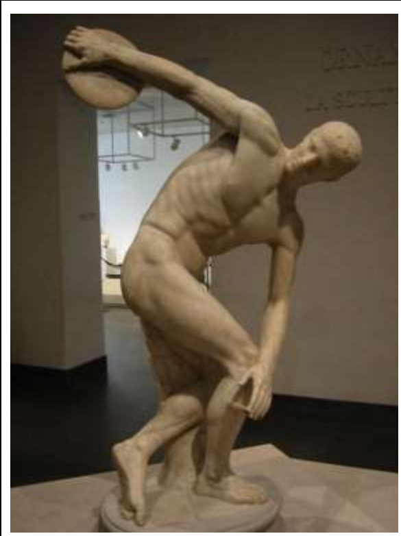
صوره رقم (1) رامي القرص -الرخام- ارتفاع حوالي 152 سم- المتحف الوطني لروما، نسحه من الاصل البرونزي - النحات اليوناني مايرون (Myron) - 450 ق.م

تمتاز منطقة الحضارة العربية التي تمتد من المحيط إلى الخليج بأن لدى شعوبها فلسفة روحية خاصة تختلف عن فلسفة الاغريق والرومان وتنعكس على فنونهم فتطبعها بطابع خاص مميز، التي تمثلت في الميتافيزيقا وعبرت عنها الاساطير وجسدها النحت في تقليده للأشكال الطبيعية بصوره مثاليه صورته (1) فالفن الإسلامي يعد من أنقى وأدق صور التعبير عن الحضارة الإسلامية..، وفيما يلي بعض أهم الخصائص والسمات التي تميز بها هذا الفن الأصيل: