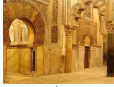
صوره رقم(2) جامع قرطبة الكبير أهم آثار مدينة قرطبة ومن أهم المواقع الأثرية على الإطلاق في قرطبة هو مسجدها الكبير، فقد بدأ إنشاؤه في عهد عبدالرحمن الداخل عام 170 هـ - 786 م- وفيه نفس الزخارف كما في قصر اشبيليه(صورة 3).