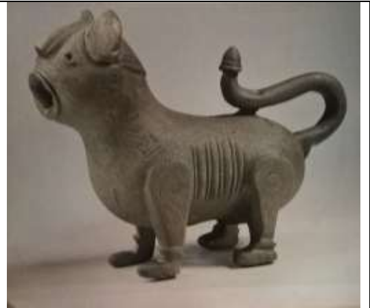
صوره (6) اسد من نافوره ماء -القرن 5-6 هـ - متحف الفن الاسلامي- برلين

وفي صوره رقم(7) نشاهد تمثال صغير لظبي مصنوع من البرونز، وتغطيه أوراق وأغصان ، التمثال صمم في وضع الوقوف. وجرّد الفنان الأبعاد التشريحية بشكل مبسط وهذا يتضح من شكل الأرجل والذيل المتدلي والأذنين المرفوعتين والفم والعينين .